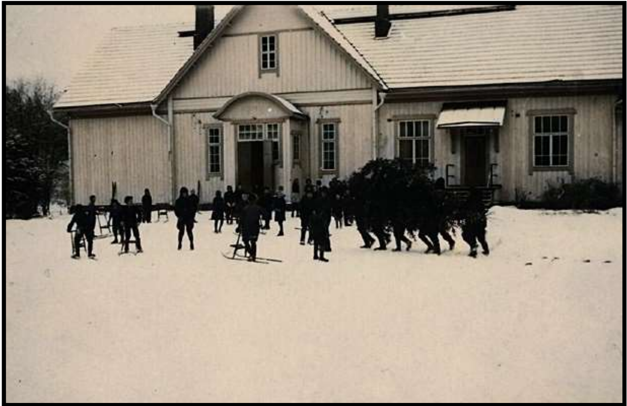
Kaukolan Järvenpään kansakoulu sota-aikana