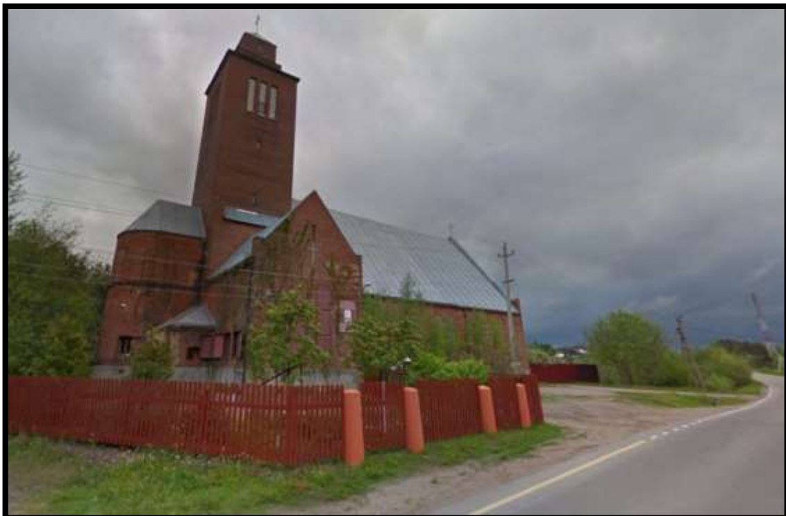
Kaukolan kirkossa toimi vielä 2021 Inkerin kirkko ja sitä tukivat useat suomalaiset seurakunnat. Kirkossa toimi Neuvostoliiton aikaan kanala ja se kunnostettiin 2000-luvulla jälleen kirkoksi.