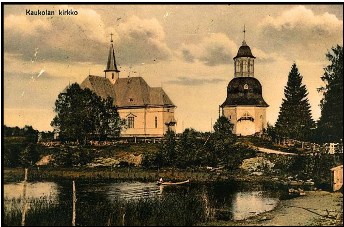
Kaukolan vanha kirkko, joka tuhoutui tuhopoltossa 1932. Uusi kirkko valmistui 3.9.1933, alla kuva Kaukolan kirkosta kesältä 2017