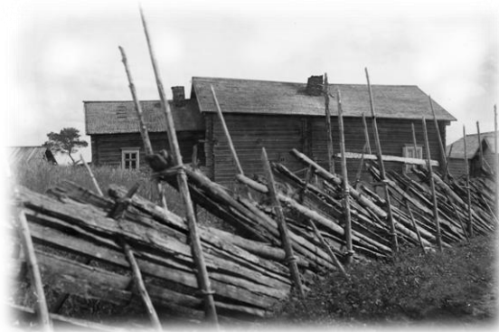
Kuolismaassa sijaitseva Matinvaaran tila. Kuva v. 1907. SKS 1206 Samuli Paulaharju

Ensimmäiset asukkaat Kuolismaahan saapuivat keskiajajalla. 1500-luvun alussa kylässä oli ainakin kolme pirttiä. Vatjan viidenneksen verokirjassa Kuolismaan kylän nimi mainitaan Lovenan kylänä, joka kuului Pogostan veronmaksupiiriin. Keskiajan sodat päättyivät Stolbovan rauhaan vuonna 1617 ja niin uskaltautuivat Kuolismaan asukkaat piilopirteistään jälleen ihmisten ilmoille. Heidän joukossaan mainitaan vuonna 1618 Jakush Rodivonov, jonka etunimi viittaa läheisen Jakunvaaran nimeen. Lovena nimitys johtuneen läheisen Luovenjärven nimestä. Kuolismaan kylä ilmestyy verokirjoihin omalla nimellään vuonna 1589, jolloin siinä on maininta ”talollinen Pedri Timonpoika”. Seuraavalla vuosisadalla vuonna 1618 mainitaan Iivan Miihkalinpoika Hattu kylän vauraimpana viljelijänä. Vuonna 1631 verollisina mainitaan Hatun lisäksi Ontoka Ulassioff (Vlasoff), Isatsko Ulassioff, Saska Pedrojeff, Jakushka Tarhanoff. Vuoden 1688 veroluettelossa on maininta neljästä talosta: luterilaisista Simo Sykkö ja Martti Luostarinen sekä ”oikeauskoiset” Drohkima Isakoff ja Maksima Gauriloff. Vuonna 1696 taloluku kohosi 16:ksi, joista 4 karjalaista ja 12 luterilaista talollista.