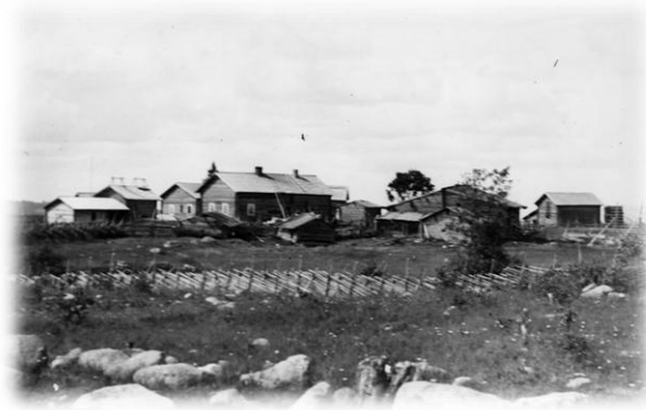
Miikulanvaarassa sijaitseva Kuolismaan Kettusten Kuolismaan 3 tila.