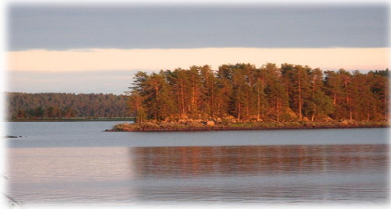
Ala-Vieksijärvi, takana Lokalahden Haisova

Ilomantsin väkiluku nousee 1950-luvun puolivälissä lähelle 13 700 asukasta, mutta maaseutuammattien ja metsätöiden vähenemisen aiheuttama työttömyys aiheuttaa väestön siirtymistä töiden perässä muualle suomeen, myös rajojemme ulkopuolelle. Vuosien kuluessa myös pääosa Kuolismaan Kettusten lapsista ja lastenlapsista siirtyivät pois Ilomantsista. 1980-luvulla teollisten työpaikkojen voimakas lisääntyminen hidasti väestön vähenemistä, mutta 1990-luvun alussa koettu lamakausi aiheutti yritysten siirtymistä Ilomantsista muuanne ja sen seurauksena väestö väheni nopeasti. Vuonna 2011 Ilomantsin väkiluku on alle 5 900 asukasta ja asukkaiden määrä ennusteiden mukaan vähenee tasaisesti ja kymmenen vuoden kuluessa väestön määrä laskee alle 5 000 asukkaan.