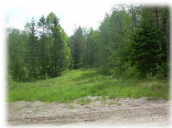
Kuvia Lutikkavaarasta 2000-luvulla