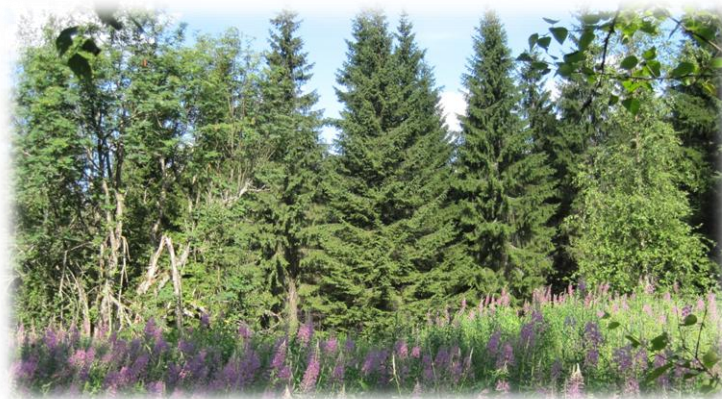
Kuvia Longonvaaralta 2010 heinäkuu