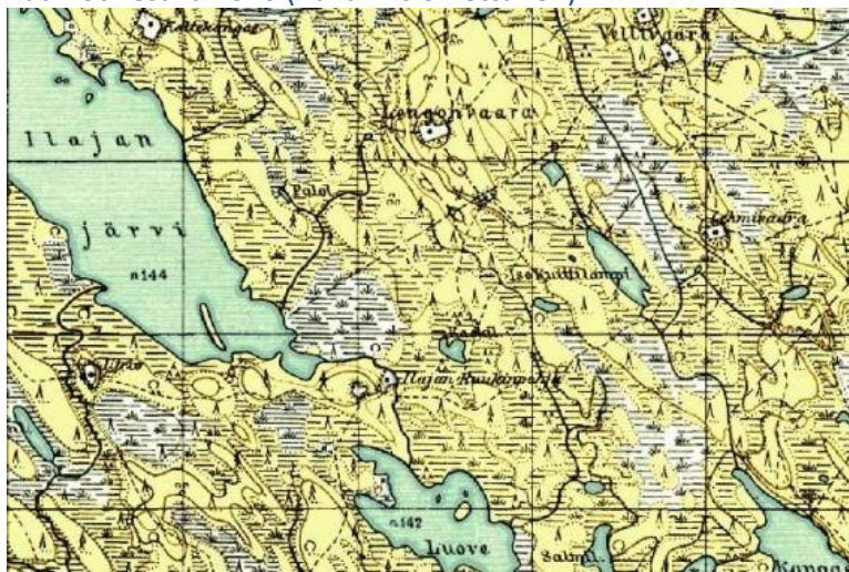
Longonvaara, Vellivaara, Lehmivaara ja Ilajan Ruukki.

Sodan jälkeen Kettuset joutuvat etsimään uudet asuinsijat eripuolilta Suomea, pääasiassa Ilomantsista. Kuuksenvaaraan, Möhköntien varteen muuttaa vuosien saatossa viittä eri sukuhaaraa olevaa Kuolismaan Kettusta perheineen. Lisäksi rajan takaa asuneita Kettusia muuttaa mm. Möhköön, Leppärinteeseen, Maukkulaan, Issakkaan, Sonkajaan, Hakovaaraan, Huhuksen tien varteen ja Ilomantsin kirkonkylän alueelle. Muutamassa vuodessa Kettuset saavat rakennettua uudet asuinrakennukset ja talusrakennukset valmiiksi ja elämä alkaa kukoistaa uudelleen sodan, evakkomatkojen ja tuhattujen kotien jälkeen.