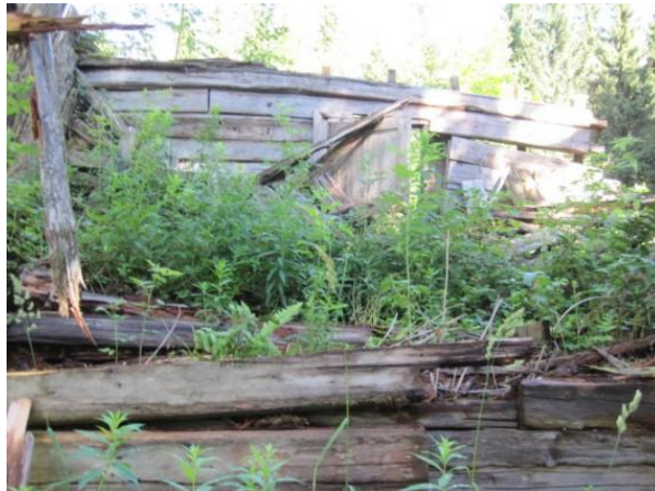
Longonvaaran torpan rauniot kesällä 2010

Kuolismaan Kettusten perheet kasvavat ja Kuolismaan lähikylien asuinpaikat saavat vuosien saatossa asujikseen sukumme Kettusia aina vuoteen 1939 saakka, jolloin Neuvostoliitto (nyk. venäjä) aloittaa sodan maamme vastaan. Sukumme asuinpaikat jäävät sodan jälkeen maamme itärajan taakse. Sukumme jäseniä asui v.1939 mm. Kuolismaan kylässä, Itkajärven rannassa, Miikkulanvaarassa, Leppävaarassa, Lutikka-vaarassa, Ontronvaarassa, Vellivaarassa, Longonvaarassa (sijaitsee suomen puolella rajavyöhykkeellä) jne.