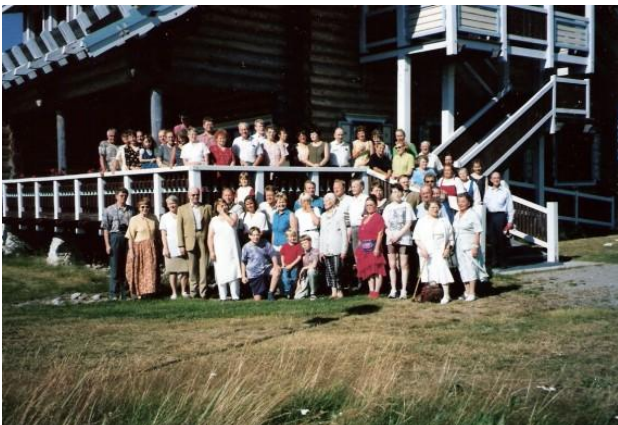
Kettusia Parppeinpirtillä v. 1999