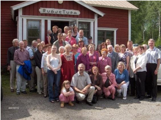
Kuolismaan Kettusia Ruajetuvalla v. 2007