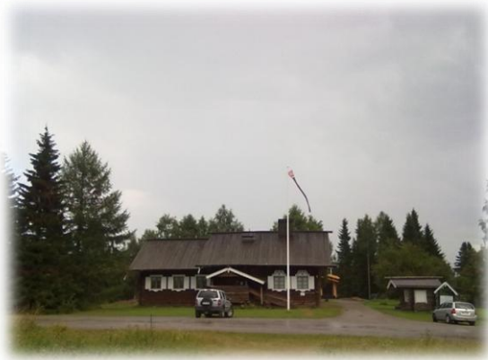
Ukkospilvet Runopirtin ja Ilo-mantsin yllä

aan ympärille. Posti jaettiin huutamalla postipaketissa, postikortissa tai lehdessä olleen henkilön nimi. Jos henkilöä ei löytynyt paikan päältä, se jätettiin kaupan sisällä olevalle pöydälle odottamaan noutamista. Vuosi 1961 oli sateinen ja syys-talvella sudet alkoivat liikkua talojen pihalla. Susia alettiin metsästää joukolla ja pian kaupan pihassa kellotteli parhaimmillaan 4 – 5 sudenraatoa joita tutkiskelimme postinhakumatalla. Joulukuun 1961 oli lähes lumeton. 1960-luvun alussa Ilo-mantsissa asui yli 14 000 henkeä. Nyt asukasluku on painunut alle 6 000 asukkaan. Nykyisen hallituksen tavoitteena on vähentää kuntien määrää alle puoleen nykyisestäään. Ilo-mantsin kunnalle asia on kohtalon asia. Kuntamme vaakunassa on kohtalon kannel, joka taitaa soittaa viimeisiä säveliä itsenäisen kuntamme kohdalla.