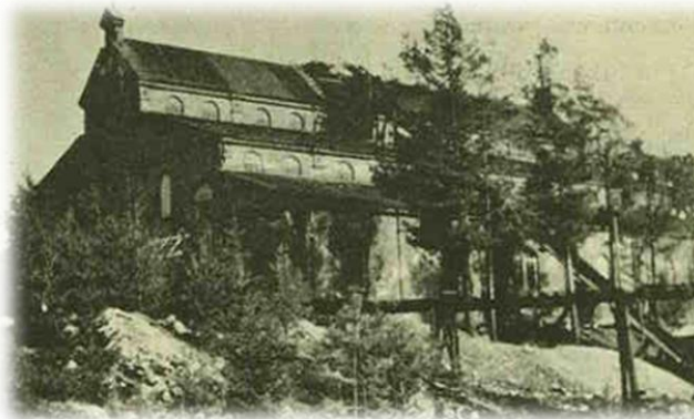
Kuvassa Pitkärannan sellutehdas