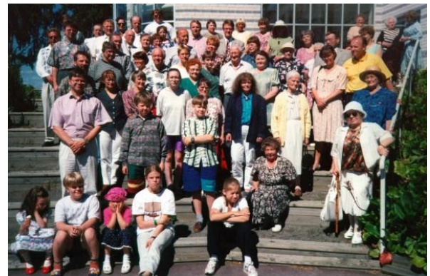
Kettusia Pääskynpesällä v. 1997