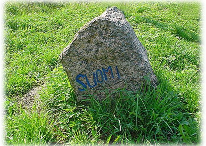
Manssilan peltoaukealla oleva vanha rajakivi

oli 1 423 km 2 , joista peltoa 6 000 hehtaaria. Salmisissa asui ennen sotia noin 14 500 asukasta. Salmiin kuului kaksi saarta Mantsinsaari ja Lunkulan saari, jotka sijaitsevat Salmin kirkonkylän kohdalla Laatokalla. Ennen sotaa Mantsinsaarella asui n. 1 500 asukasta ja Lunkulansaarella n. 1 250 asukasta. Manssilan kylä sijaitsi aivan valtakunnan rajalla ja siellä asui ennen sotaa yli 500 asukasta.