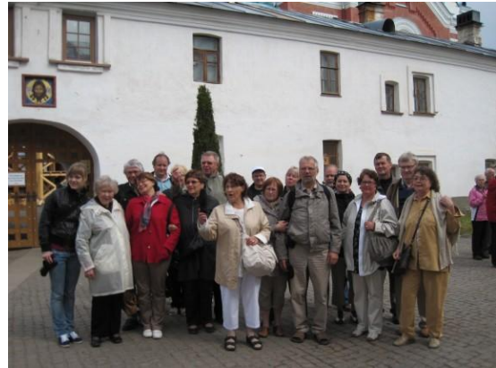
Valamossa Kuolismaan Kettusia v. 2011