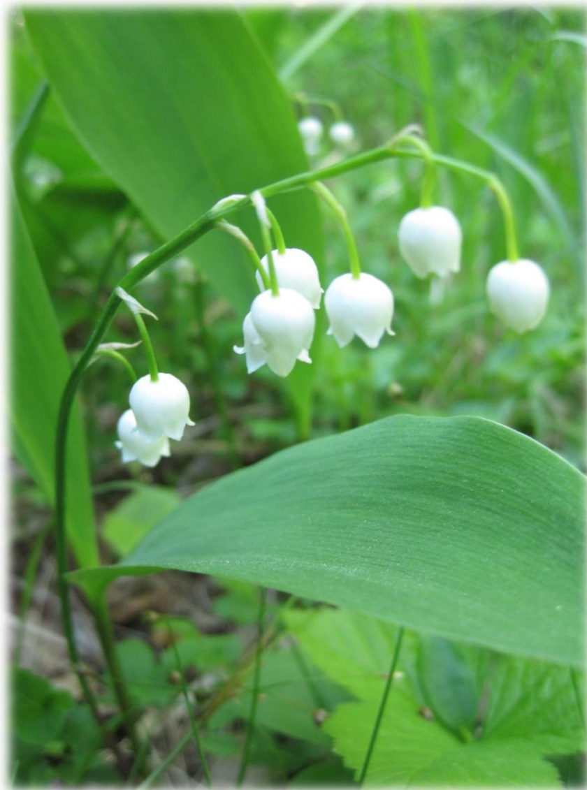
Kielo, (Convallaria majalis)