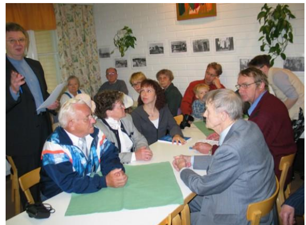
Vuonna 2003 Mekrijärven tutkimusasemalla