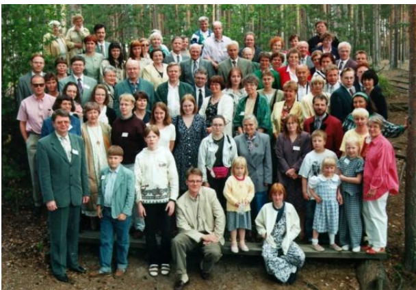
Kettusia Petkeljärvellä v. 1996

Seuraavana on lyhyt katsaus seuramme historiaan ja sukumme vastuuhenkilöihin.