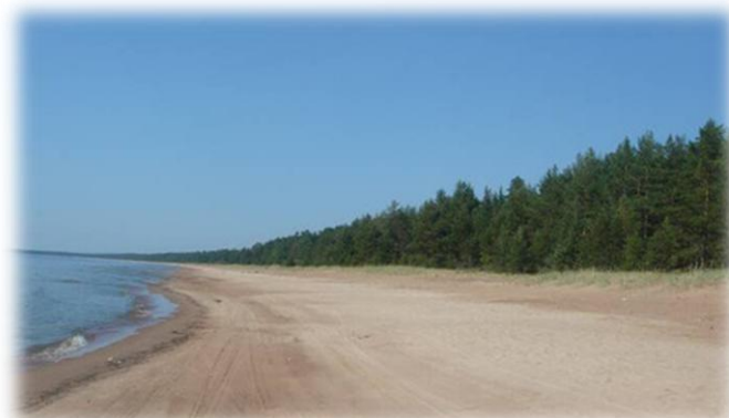
Laatokan rantaa Viteleessä

Jatkoimme matkaa Viteleen ja Tuuloksen kautta kohti Aunuksen kaupunkia. Viteleen ja Tuuloksen tienvarsilla oli juoksuautoja ja sota-aikaisia pommikuoppia. Pistäydymme Laatokan rannalla Viteleen ja Tuuloksen välillä. Ranta oli todella kaunista, silmäkantamatonta hiekkarantaa. Ranta-alueelle kesällä 1944 venäläiset joukot tekivät maihinnousun ja katkaisivat suomalaisilta joukoilta selustayhteyden. Joukkomme pelastautuivat kiertämällä korpien kautta, jättäen raskaimman aseistuksen venäläisten haltuun.