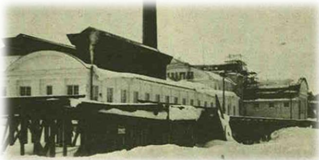
Kuvassa Pitkärannan kaivoksen rakennuksia

Salmin jälkeen pysähdyimme Manssilan kylän kohdalle etsimään entistä Suomen ja Neuvostoliiton rajakiveä, jonka löysimme pellolta tien varresta. Manssila kuului ennen sotia Salmin pitäjään ja oli rajalla sijainnut kylä. Salmin kunnan pinta-ala