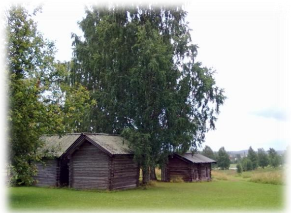
Parppeinvaaran aitat kesällä 2011

Ilo-mantsissa voi harrastaa metsästystä, marjastusta ja kalastusta. Maisemat ovat ulkopuolisista katsottuna hyviä. Meille vakituksille asukkaille maisemat eivät välttämättä ole normaalia parempia. On paljon aukkohakkualueita, pajujen täyttämiä vanhoja peltoja ja joitakin huonokuntoisia taloja. Venäjällä matkatessani olen ajatellut, että maisemat täällä ovat todella kauniita. Saamme olla ylpeitä asuinkunnastamme ainakin muutaman vuoden ajan, kunnes kohtalonamme on yhdistyvä työssäkäyntialueen suureen kuntaan.