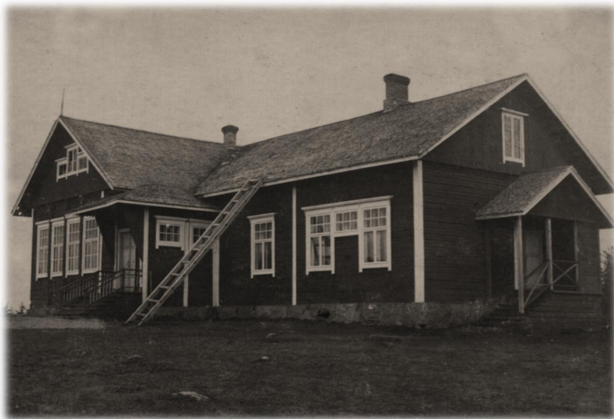
Kuolismaan koulu 1930-luvulla