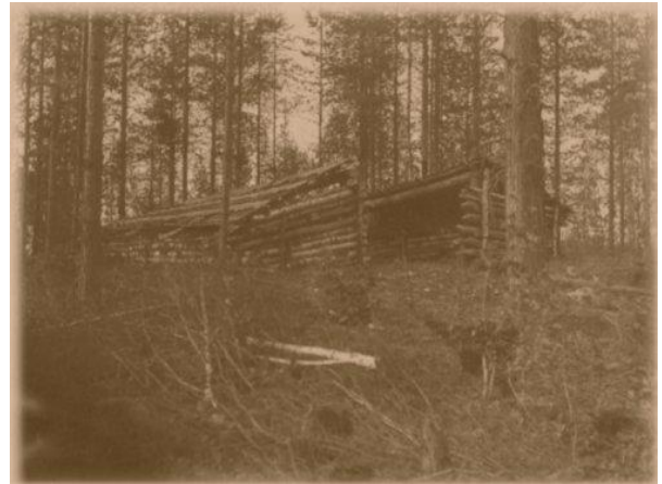
Metsämajoja Kuolismaan tien varressa.

Näkeepä salolla joskus myös metsämajan, minkä saloa samoilevat metsämiehet tai kalamiehet ovat tilapäiseksi suojakseen laittaneet sadetta, tuulta tai pakkasta vastaan. Tavallisesti on se kuusenkuoresta, koskuksista seipäidenvaraan laitettu. Useimmin tapaa kolmella seinäisiä viistokattoisia majoja, niissä katto ja sivuseinät koskuksista, matala peräseinä parista kolmesta päälletään asetusta pölkystä. Etupuoli on avonainen. Siinä majan edessä pakkasella tulta pitävät. Matalassa majassa ei seisomaan sovi, istumaan vain tai loikomaan.