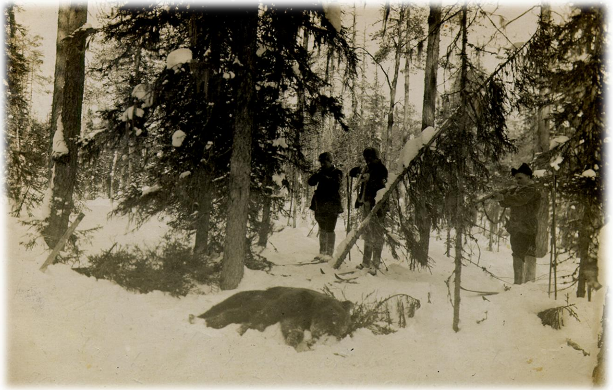
Karhun kaato Kuolismaassa 1930-luvulla