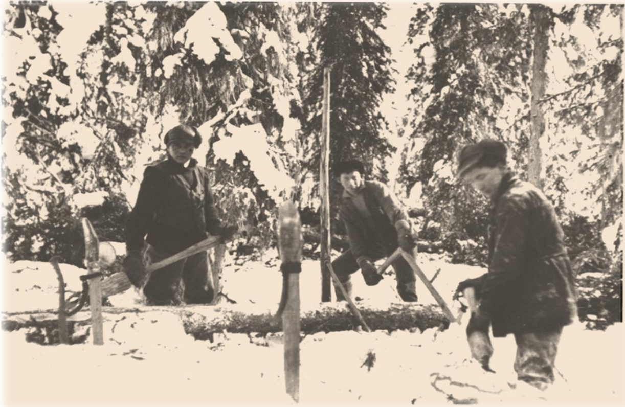
Savottalaisia Kuolismaan salolla 1930-luvulla