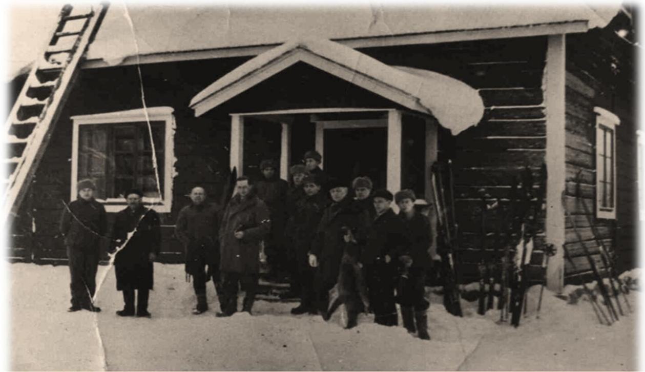
Pahkalammin vartio 1930-luvulla