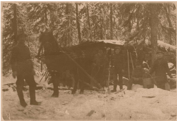
Pieni kämppä Miikulanvaaran saloilla

Retkeillessä Karjalan saloilla kohtaa silloin tällöin metsässä tai salojärven rantamalla pienen metsäsaunan, joka on kuin Kalevalan piilopirtti pikkurainen, kolmen kuusen kulman alla. Se ei ole suuren, suuri eikä ylen korkea. Pituutta on seinillä noin kolme meriä ja korkeutta tuskin puolitoista. Suurista, pyöreistä hongankeloista on se salvottu. Salvos on mitä alkuperäisintä laatua nimeltään koirankaulasalvos. Pölkkyjen päät vuorotellen vain työnnetty toisensa kylkeä vasten ja jotta pölkky paikoillaan pysyisi, on kylkeen vähäsen veistetty hammasta, johon pölkyn viistoksi veistetty pää on sovitettu. Pieni, miltei ryömittävä ovi on nurkassa, uuni siellä ovipielessä, perässä pieni ikkuna, siltana maa, sammalilla ja heinän pehkuilla peitetty. Kalamiehet kalalla ollessaan ja metsämiehet eräretkillään asustavat salvoksessa. Joskus siihen salon matkamieskin yöpyy. Saunan lämmitessä ollaan ulkona, mutta kun saunasta on savu ja kitsku on häipynyt, mennään sisään, pistetään ikkunaan sammaltype ja heittäytyään pehmeälle permannolle loikomaan. Suloinen on siellä loikoa ja nauttia lämpöisestä, varsinkin jos ulkona paukkuu pakkaneen tai roiskii synkän syksyn rankka sade. Unta odotellessa siinä kaskutah i pagistah. Metsämiehet pakinoivat päivän tapahtumista pyyntiretkillään taikka muistelevat entisiä urotöitään. Samoin kalamiehet.