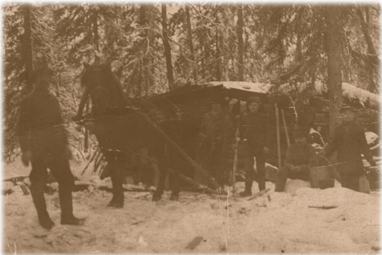
Miikulanvaaran salolla oleva savottakämppä 1930-luvulla