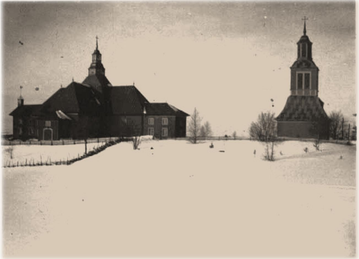
Ilomantsin kirkko 1930-luvulla