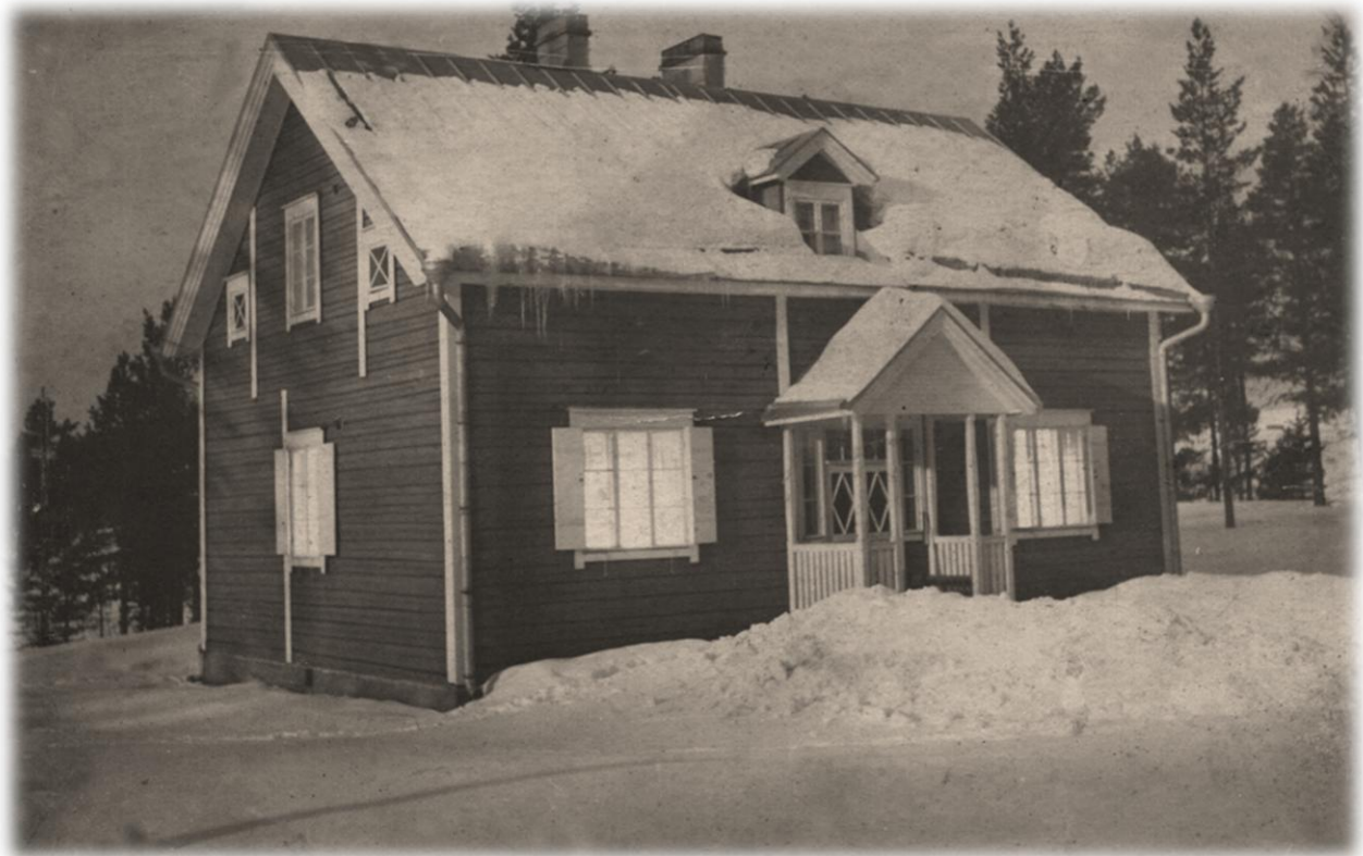
Kuolismaan sairausmaja v. 1938