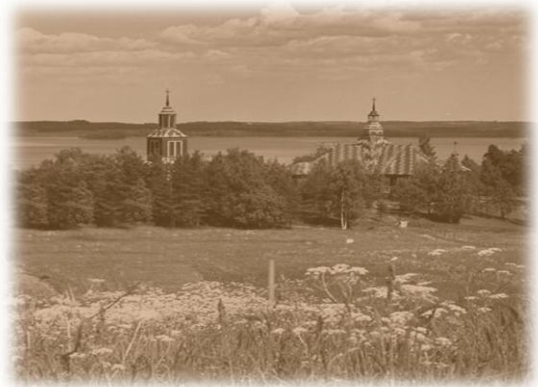
Ilomantsin kirkko 1950-luvulla

Kun Joulupukki oli lähtenyt, avasimme lahjapaketit. Minä sain suklaalevyn, uudet villasukat rikkonaisten tilalle, alusvaatekeraston, yhden vihreän, pellistä valmistetun auto, inkkaripäähineen ja muovisen intiaanisotilaan. Illan aikana saimme syödä mahan täyteen täytekakkua, kahvia, hedelmiä ja karamelleja. Uusien leikkikalujen kanssa leikimme myöhään yöhön saakka. Väsyneenä, mutta onnellisina yksi toisensa jälkeen menimme vuoteillemme ja nukahdimme. Lap-suuteni ensimmäinen muistissa säilynyt joulu oli alkanut.