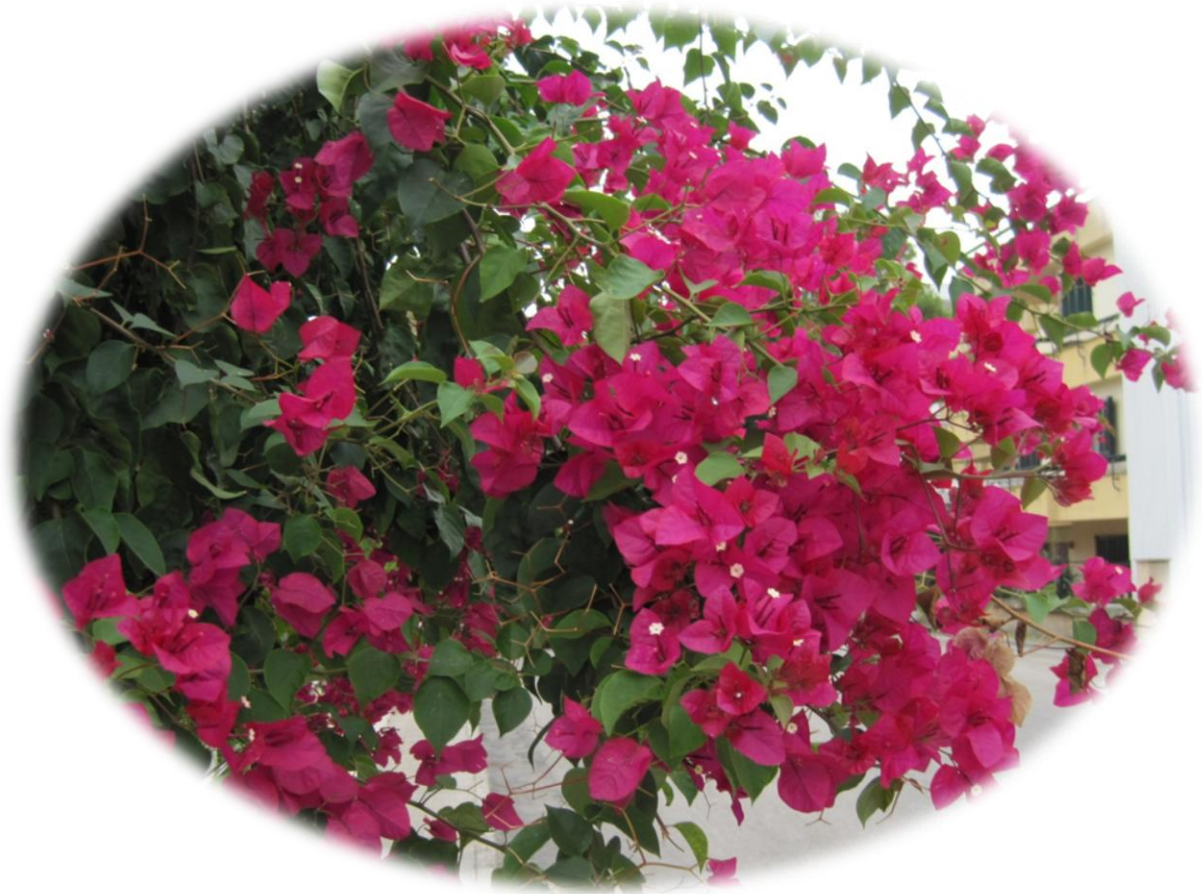
Ihmeköynnös (Bougainvillea) Mallorcalla lokakuu 2012

Hyvää Joulua ja Onnellista Uutta Vuotta 2013