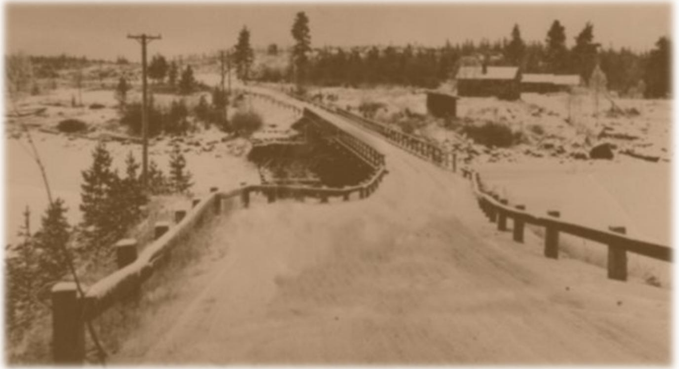
Oinassalmen väliaikainen silta sodan jälkeen