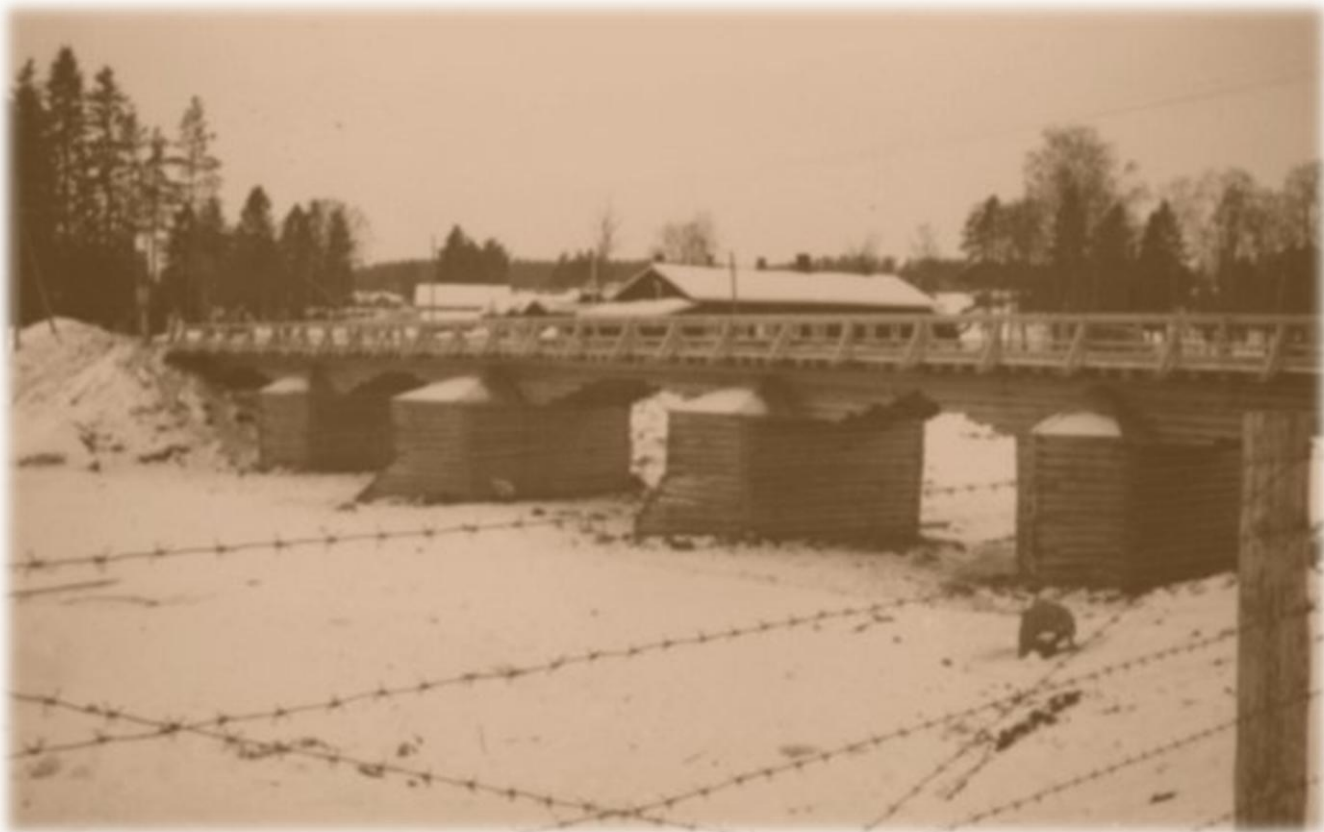
Venäläisten talvisodassa rakentama silta Möhkössä