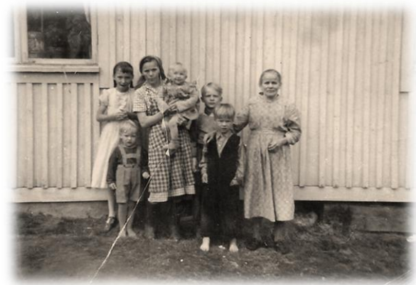
Kettusen perhe kesällä 1959

pelaamassa jalkapalloa naapurin poikien kanssa. Unessa juokseminen oli kankeaa. Tuntui kuin jalat olisivat kiinni maassa, en päässyt eteenpäin. Heräsin uudelleen huoneen oven kolahdukseen. Äiti tuli huoneeseen ja katsahti minuun, sanoen: ”Nouskaahan ylös, kahvi on valmiina. Poikien pitää hakea kahvin jälkeen sammalia lehmien alustarpeiksi.”