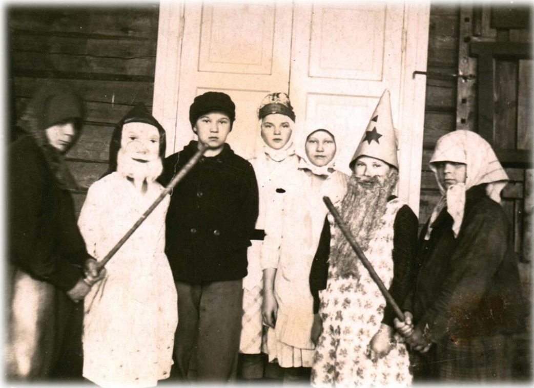
Tiernapojat Kuolismaan koululla 1930-luvulla