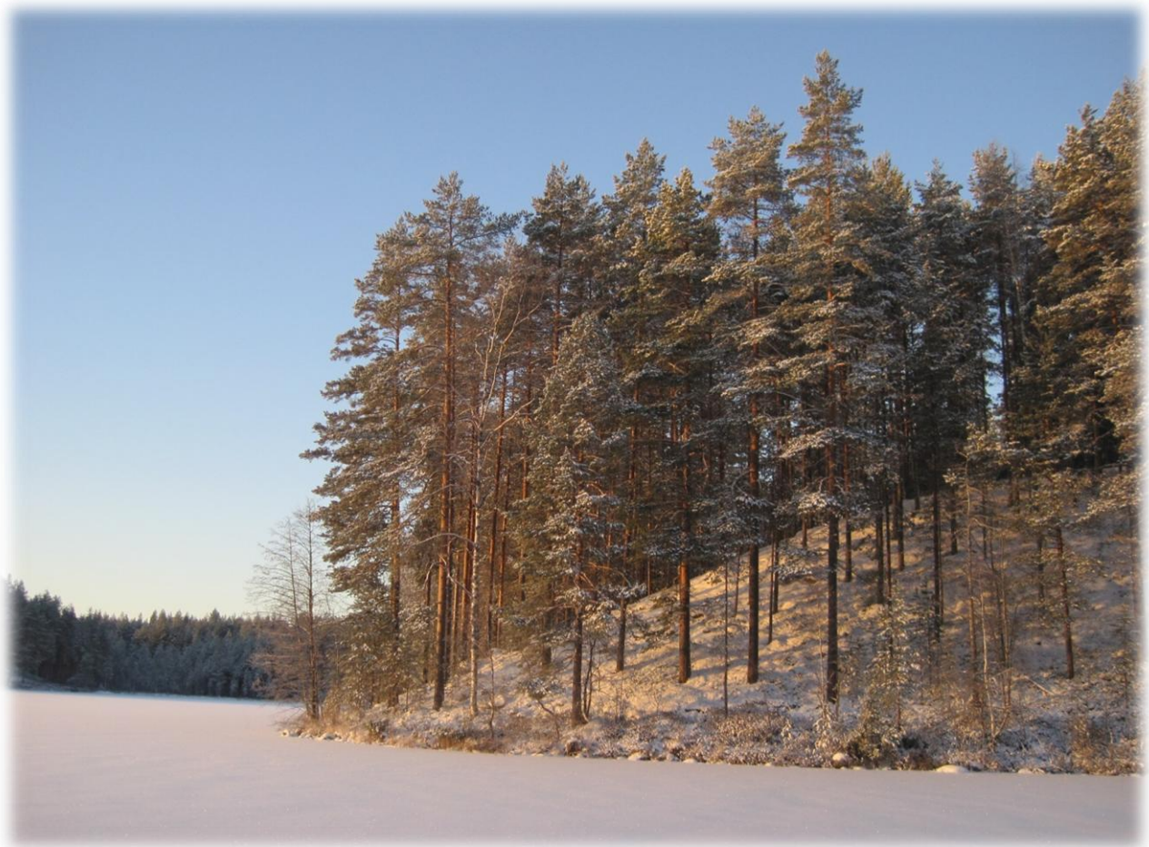
Kuva: Kevät koittaa, aurinko voittaa. Kuva Tetrijärveltä