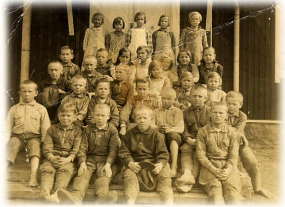
Kuolismaan koulun opiskelijoita v. 1939

na uutta koulua, vaan koulun paikalle tehtiin parakeista väliaikainen koulurakennus. Etsin koulun paikkaa Kuolismaassa kesällä 2001, mutta en löytänyt sitä. Kesällä 2006 sukuseuran matkalla löysimme Kettulanvaaran rinteellä sijainneen koulun paikan pajujen keskeltä. Jäljellä oli tiilikasat ja päätyoven alarappu.