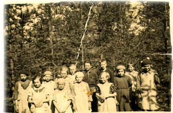
Luonnontietotunti Kyläjärven rantametsässä