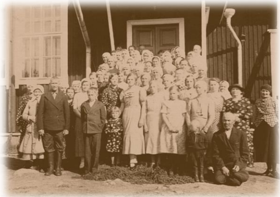
Kuolismaan koulun äitienpäiväkuva 1930-luvulla.