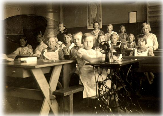
Kuolismaan tyttöjä käsityöluokassa 1930-luvulla