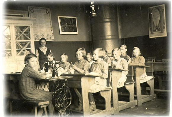
Käsityötunti Kuolismaan koulussa 1930-luvulla