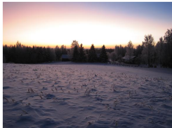
Aamuaurinko nousee idästä

Sukututkijaksi en ole itseäni koskaan mieltänyt, vaikka olenkin paneutunut sukujen tutkimiseen, joskus aivan liian intensiivisesti. Harrastuspohjalta tapahtuva yhden tai muutaman suvun käsittävä sukututkimus on joka tapauksessa näpertelyä varsinaisten sukututkijoiden silmissä. Suosittelen sukujenne tutkimista ja ennen kaikkea vanhojen ihmisten haastattelututkimusta. Niistä saa parhaimman kuvan heidän elinpiiristä ja suvun taustatiedoista.