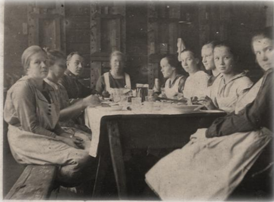
Kuolismaan tyttöjä veistoluokassa 1930-luvulla