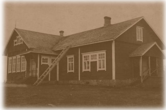
Kuolismaan koulu 1920 – luvulla

työopettajan avustus oli 50 mk. Ehtona avustuksen saannille oli, että koululle rakennetaan kellari ja varataan riittävä määrä maata koulupuutarhaa varten.