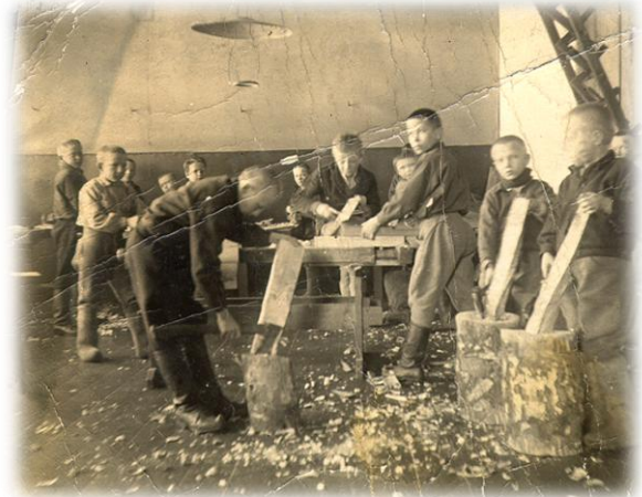
Veistotunti veistoluokassa 1930-luvulla