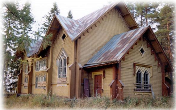
Kuikanniemen kirkko Suojärvellä vuonna 2002

En ole historioitsija enkä historian tutkija. Historia ja sukujen tutkiminen alkoi kuitenkin kiinnostaa 1980-luvulla. Ensimmäisenä tutkimuskohteena olivat äitini suvut Tsutsut ja Purmoset. Tsutsusen suku oli asunut Suojärven Varpakylässä ja Vegaruksessa. Vegarus ja Varpakylä sijaitsivat Suojärven Suvilahdesta pohjoiseen, Ilomantsin suuntaan. Tsutsusten osalta tein sukututkimusta Suojärven ortodoksisen seurakunnan ja Purmosten suvun osalta Ilomantsin ortodoksisen seurakunnan metriikoista, rippikirjoista ja ns. pääkirjoista. Ortodoksin kirkon metrikat, rippikirjat ja pääkirjat ovat venäjänkielisiä 1920-luvulle asti. Myös henkilöiden nimet ovat venäjänkielisessä asussa kirkonkirjoissa. Ortodoksissa kirkonkirjoissa ei käytetty sukunimiä ennen 1800-luvun loppua. Sukunimen korvaa niissä isännimi. Näiden seikkojen vuoksi Tsutsujen ja Purmosten sukujen tutkiminen on ollut haastavaa ja omalta osalta paljon vaikeampia kuin vastaavasti luterilaisten kirkonkirjojen tutkiminen.