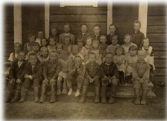
Oppilaat ulkovaraston edessä vuonna 1938

Talvisodan jälkeen venäläiset kuljettivat koulun kivijalan kivet Kuolismaan alueen bunkkereihin. Kuolismaahan ei rakennettu jatkosodan aika-