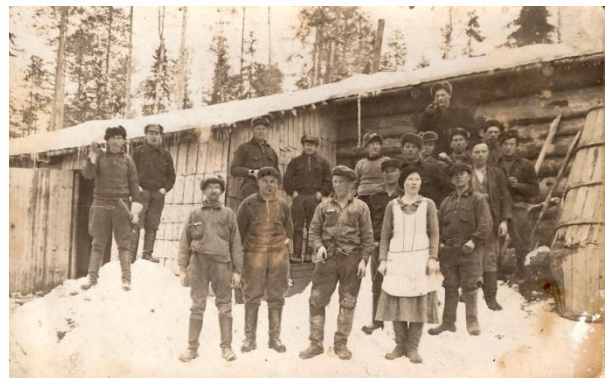
Läävästö vanha kämppä 1930-luvulla