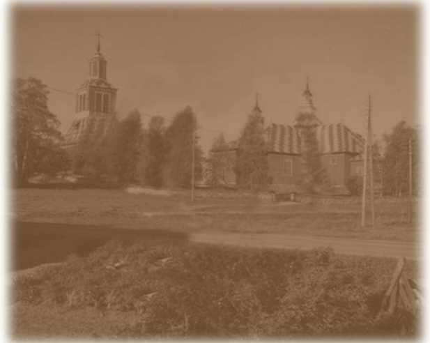
Ilomantsin kirkko 1950-luvulla

kuuta tutkitaan hakemalla tietoja pääasiassa rippikirjoista, syntymä-, vihittyjen- ja kuolleiden kirjoista. Suvun tutkiminen on netin kautta vaivastonta verrattuna aiempaa mikrofilmeistä hakua. Lisäksi sukutietoja voi hakea toiselta sivustolta osoitteesta: http://hiski.genealogia.fi/hiski?fi , jossa kaikki tiedot ovat haettavissa hakusanoilla.