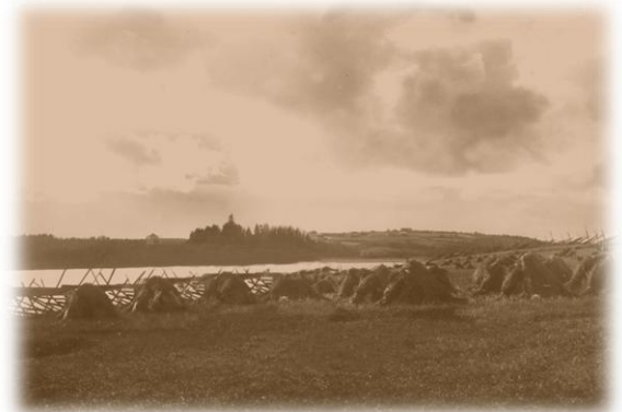
Kuolismaan sairausmaja oli kuvan pellolta oikealle n. 150 m.

vat kukat, ja juurikasvimaa sekä marjapensaat maksoivat vaalijoilleen runsaan palkan vähäisestäkin vaivannäöstä. Kesällä oli sitten Petru, Pietarin päivä, Kuolismaan oma praasniekkapäivä 12. heinäkuuta, Pyhien apostolien Pietarin ja Paavalin paaston lopettajaisineen. Jo aamuvarhaisella tuli lähikylistä vieraita tähän juhlaan, ja tietenkin he ensimmäiseksi poikkesivat majallemme, jonka salossa liehui suuri punaisen ristin lippu juhlan kunniaksi. Kahvin ja teen kera tarjottiin piiraita ja sultsinoita praasniekkaväelle, joka kirkkoherran saavuttua hiljeni rukoushetkeen kylän tsasounassa. Vuorolaulun säkeet kantautuivat rukoushuoneen niemeltä sairausmajalle, jopa haudoilla toimitettujen litanioiden sanat saattoi kuulla selvinä. Kylän kalmisto oli vastikään kunnostettu talkoovoimin, niin että nyt päästiin pitämään sielunrukouksia myös unohdetuilla ja suurten kuusten peittämällä hautakummuilla.