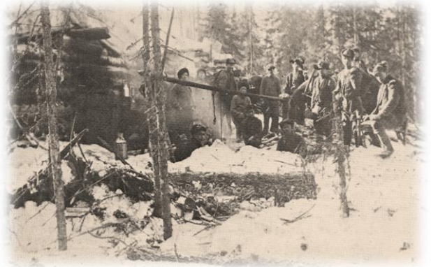
Savotta-ajan metsätyömiehet nuotiolla

Sinä kesänä liityimme Ilomantsin osuusmeijerin jäseneksi ja aloimme toimittaa maitoa meijeriin. Meijeri oli perustettu 1950-luvun puolivälin jälkeen. Myöhemmin, muistaakseni vuonna 1962, Ilomantsin osuusmeijeri liittyi Joensuun ympäristön osuusmeijeriin. Teimme heinäkuussa kylän muiden maidontoimittajien kanssa maitolaiturin koulun tienhaaraan. Maidot kuljettiin maitotokissa maitokärryillä kylän maitolaiturille. Pienemmät kahdenkymppin tonkat oli helppo nostaa maitolaiturille, mutta kolmenkymmenen ja neljänkymmenen litran tonkat jäivät meiltä lapsilta nostamatta. Separattori ja voikirnu siirrettiin joutavina aittaan. Voi tilattiin maitotonkan kanteen laitettavalla lomakkeella. Maitoauton kuljettaja jätti voipaketit laatikossa maitotonkan viereen. Heinäkuun lopussa kuskasimme veljen kanssa maidot maitolaiturille. Edellisenä päivänä äiti oli tilannut kolme kiloa voita. Tonkan vieressä oli iso voilaatikko meidän nimellä. Otimme laatikosta kolme voipakettia ja kerroimme äidille, että voita oli iso laatikollinen. Isä meni illalla tarkastamaan laatikkoa maitolaiturille ja totesi, että voit oli jätetty meille. Voita oli laatikossa yhteensä 30 kiloa. Seuraavana päivänä isä vei mopon tarakalla voilaatikon takaisin meijerille ja asia päättyi lopulta onnellisesti. Meillä ei ollut jääkaappeja, eikä kylmiä tiloja, joten voi olisi pilaantunut ajan kanssa.