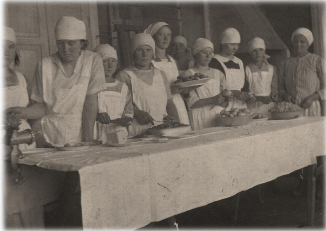
Kuolismaan opintokerholaisia kotitalouskurssilla 1930-luvulla