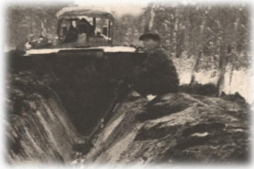
Oja-aura teki suo-ojat nopeasti

Ojasavotatkin olivat kesällä 1961 siirtymässä miestyövoimakäytöstä koneiden tehtäviksi. Ensimmäiset oja-aurat ilmestyivät Ilomantsin saloille. Heinäkuun lopussa tuli naapurin pellon viereen suuri telatraktori. Sen perässä oli suuri oja-aura. Traktori ojitti edellisenä talvena Hiis-lammin savotta-alueen suot muutamassa päivässä. Miestyövoimaa käyttäen ojitus olisi kes-tänyt koko kesän ajan.