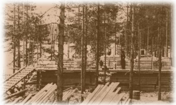
Kuolismaan sairaumajan rakennusvaihe kevät v. 1926