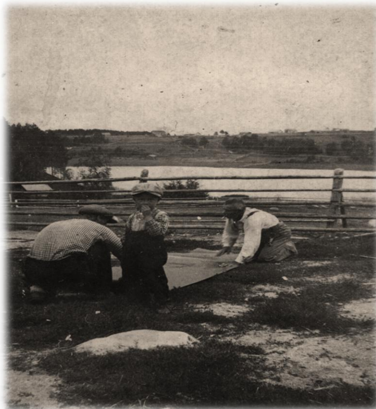
Kuva Mikitanvaaralta, mahdollisesti Parta Iivanan Kaupan pihasta, takana Kuolismaan kylä