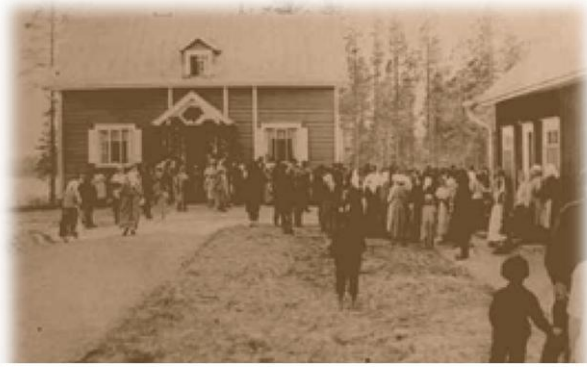
kuolismaan SPR:n sairasmajan vihkiäiset 1926

vat puutavaraa Kaukas Oy ja Enso Gutzeit Oy. Stockmann Oy lahjoitti majaan tarvittavan kaluston, sängyt, pöydät, kaapistot jne.