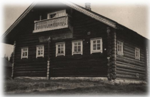
Mekrin vanha luostari vuonna 1938

istuttiin penkillä ja lattiallakin. Veden, polttopuiden ja saunan muuripadassa kypsytettyjen perunoiden kuljetus oli järjestettävä keittiön ikkunan kautta, kun varsinainen kulkutie oli tukossa vieraspaljouden vuoksi. Ennen radiokirkon alkua tarjottiin kahvia, myöhemmin nautittiin jouluateria. Tungoksesta huolimatta vallitsi majassa hiljaisuus, lapsetkin vain katselivat ja kuuntelivat. Kynttilät lepattivat pöydillä. Joku ihmetteli ääneen, että oli saatu tällainen joulu. Nyt on meillä maja kuin monasteri, kiiteltiin. Monasteri on luostari rajan kansan kielenkäytössä, ja ilomantsilaiset olivat nähneet pieniä luostareita kotipitäjäsään ennen vuotta 1918, jolloin isonvihan aikaiset vanhauskoisten luostarit Megrissä ja Pahlammilla ja erakkola Liusvaarassa olivat hävinneet.