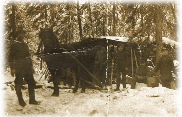
Sairaumajan hoitajien tehtäviin kuului tapaturmien ensihoito savotoilla

seudun asukkaita aina vuodesta 1926 lähtien 1950-luvulle asti. Terveysisarien hoitamat sairaumajat osoittautuivat hyvin tarpeellisiksi ja hyödyllisiksi. Valtion tuesta huolimatta sairaumajojen ylläpitäminen oli järjestölle taloudellisesti raskasta. Sairaumajojen sijoittelussa pyrittiin huomioimaan lentokoneen laskeutumismahdollisuus. Niinpä sairaumajat rakennettiin useimmiten järven rantaan, kuten Kuolismaan sairaumaja. Talvisin laskeutumisen järven jäälle ajateltiin olevan mahdollista koneen suksien avulla ja kesäisin kellukkeiden varassa.