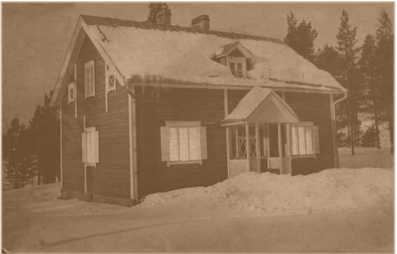
Sairasmaja rakennettiin kesällä 1926. Sairasmajan 1930-luvulla.