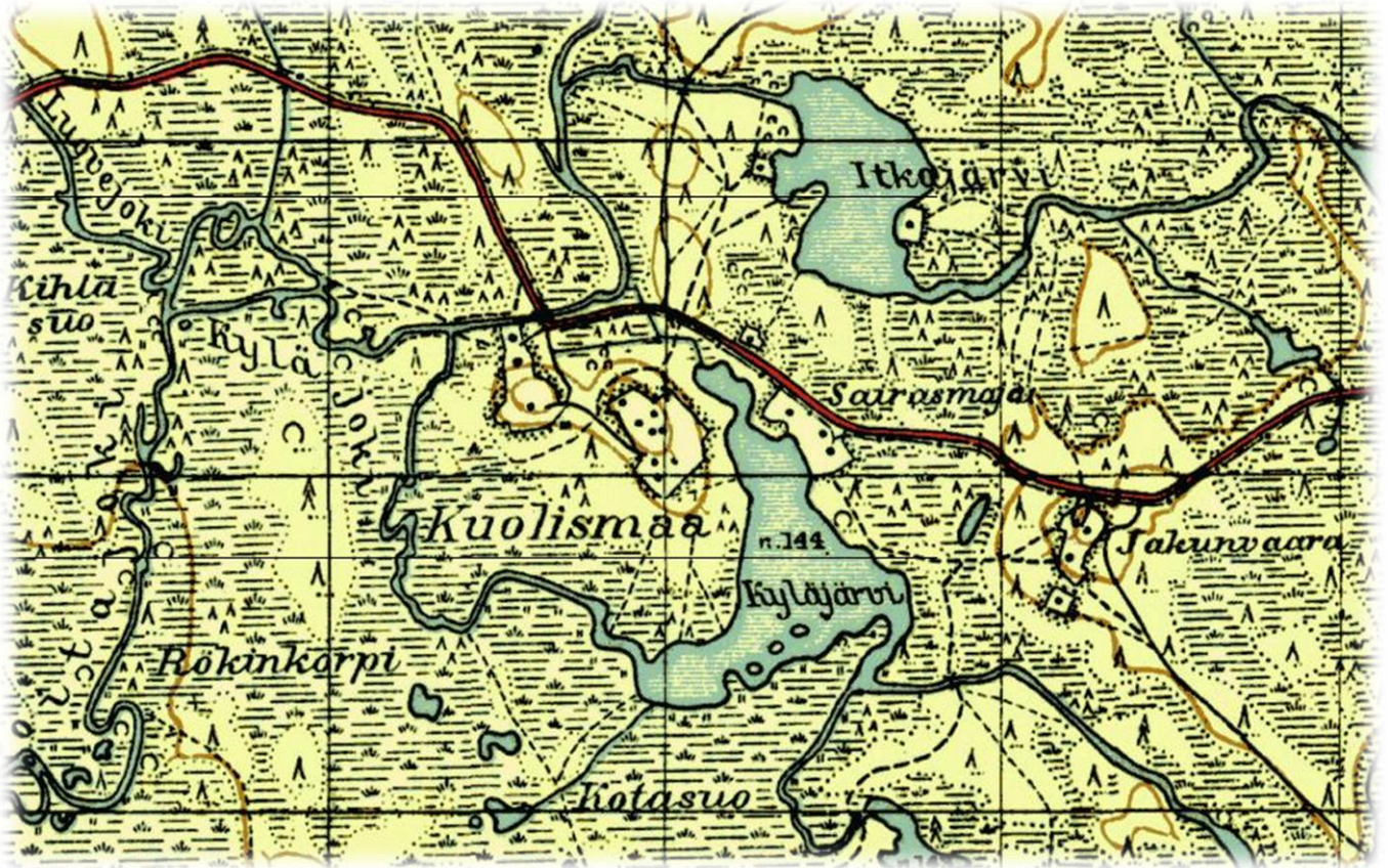
Kuolismaan Sairasmaja sijaitsi Kyläjärven koillispuolen rannassa, niemen kärjessä.