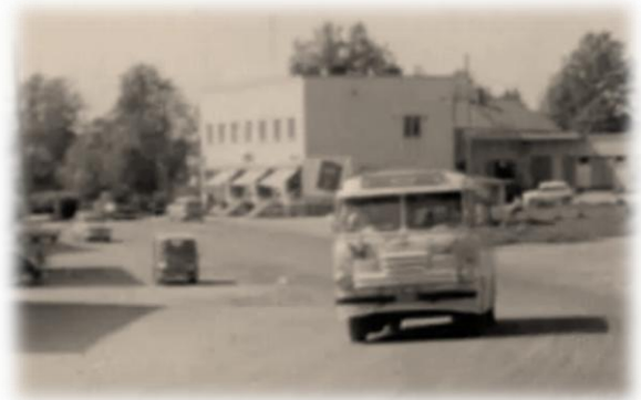
Postiauto Ilomantsin Kauppatiellä 1960-luvulla

Elokuu jatkui sateisena ja koleana aina loka-kuun loppuun saakka. Syyskuussa alkoivat yö-pakkaset ja osa meidän juurikassadosta jäi nos-tamatta jäätyneestä maasta. Syksyn aikana neu-vostoliitto antoi nootin suomelle. Vanhemmat ihmiset ovat huolissaan nootista ja pelko tarttui myös lapsiin. Marraskuussa pääsin ensimmäistä kertaa isoveljien kanssa Ilomantsin markkinoille. Markkinat pidettiin silloin urheilukentän vieres-sä. Markkina-alueella oli paljon myyntikojuja. Hevosten myyjät olivat mustalaisia. Rahaa mi-nulla oli vähän, ostin ainoastaan huuliharpun. Markkinoilta palasimme pimeää salotietä juok-semalla.