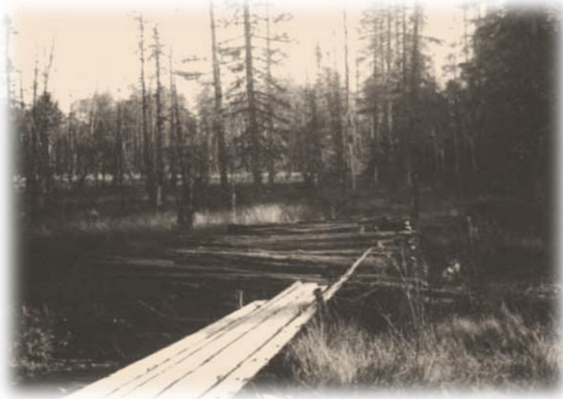
Tie Mekristä Korkeavaaraan 1930-luvulla