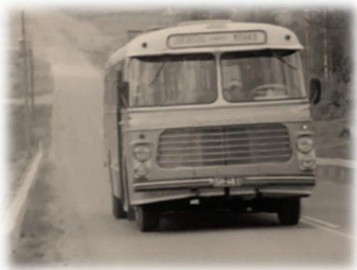
Kainulaisen linja-auto 1960-luvulla