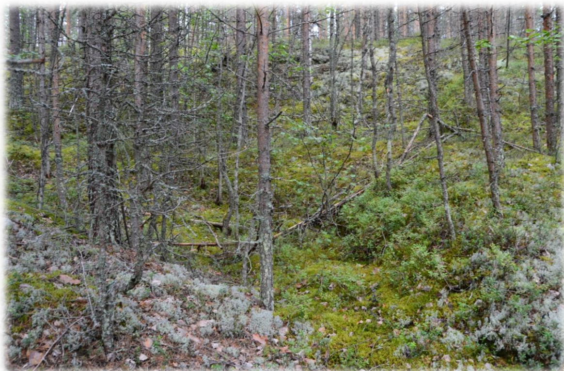
Sama paikka Pienen Kuikkalammen rannalla 21.7.2013