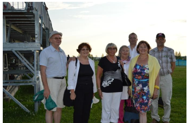
Kesäteatteriesityksen saimme viettää aurinkoisessa säässä