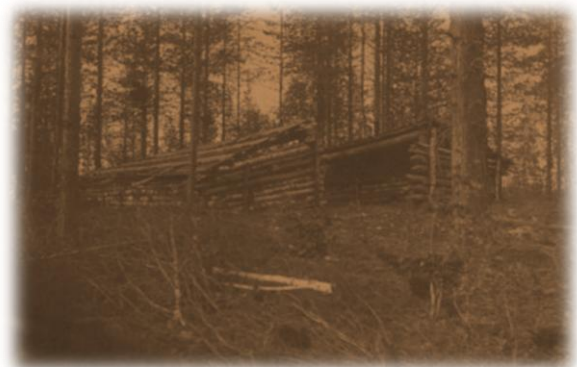
Savottalaisten laavu Kuolismaan tienvarrella

Kämppiä sijaitsi eri puolilla Kuolismaan, Liusvaaran, Lutikkavaaran ja Vuottoniemen saloja. Pakkalammen ja Vuottoniemen ympäristössä oli Enso Gutzeitin ja Metsähallituksen maita. Siellä oli useita savottakämppejä, joissa varsinkin talvikausina oli asumassa satoja metsätyömiehiä. Suuremmille kämpille rakennettiin hevosille oma talli ja miehille sauna. Työporukkaan kuului yleensä yksi hevosmies ja kaksi kaatomiestä.