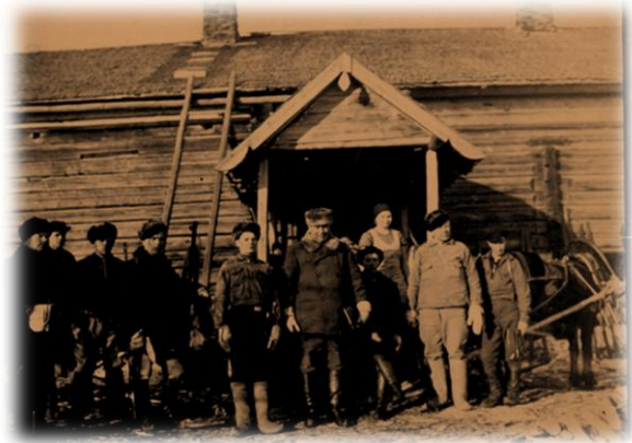
Enso Gutzeitin miehiä Miikulanvaaran Kettusilla

kämppiä. Kämpän valmistumisen jälkeen alettiin hakata metsiä. Kämpä rakennettiin vesipaikan lähelle, järven tai joen rantaan. Kämpän rakennusaineena käytettiin hirsistä, joiden väliin laitettiin sammalta. Kämpissä oli tilat metsätyömiehille ja omat tilat kämppäemännälle ja työnjohtajille. Päivisin kämpillä oli emäntä ja mahdollisesti kämppäpoika, iltaisin kämpät olivat täynnä hikisiä savottalaisia. Savottalaiset toivat ruokansa mukanaan tai ostivat ruokaa kämppäemänniltä.