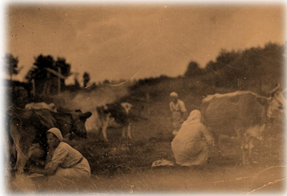
Emännät lypsällä Kuolismaassa 1930-luvulla