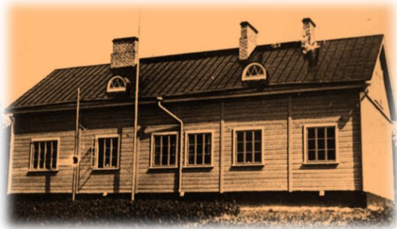
Salmijärven vartioasema 1938