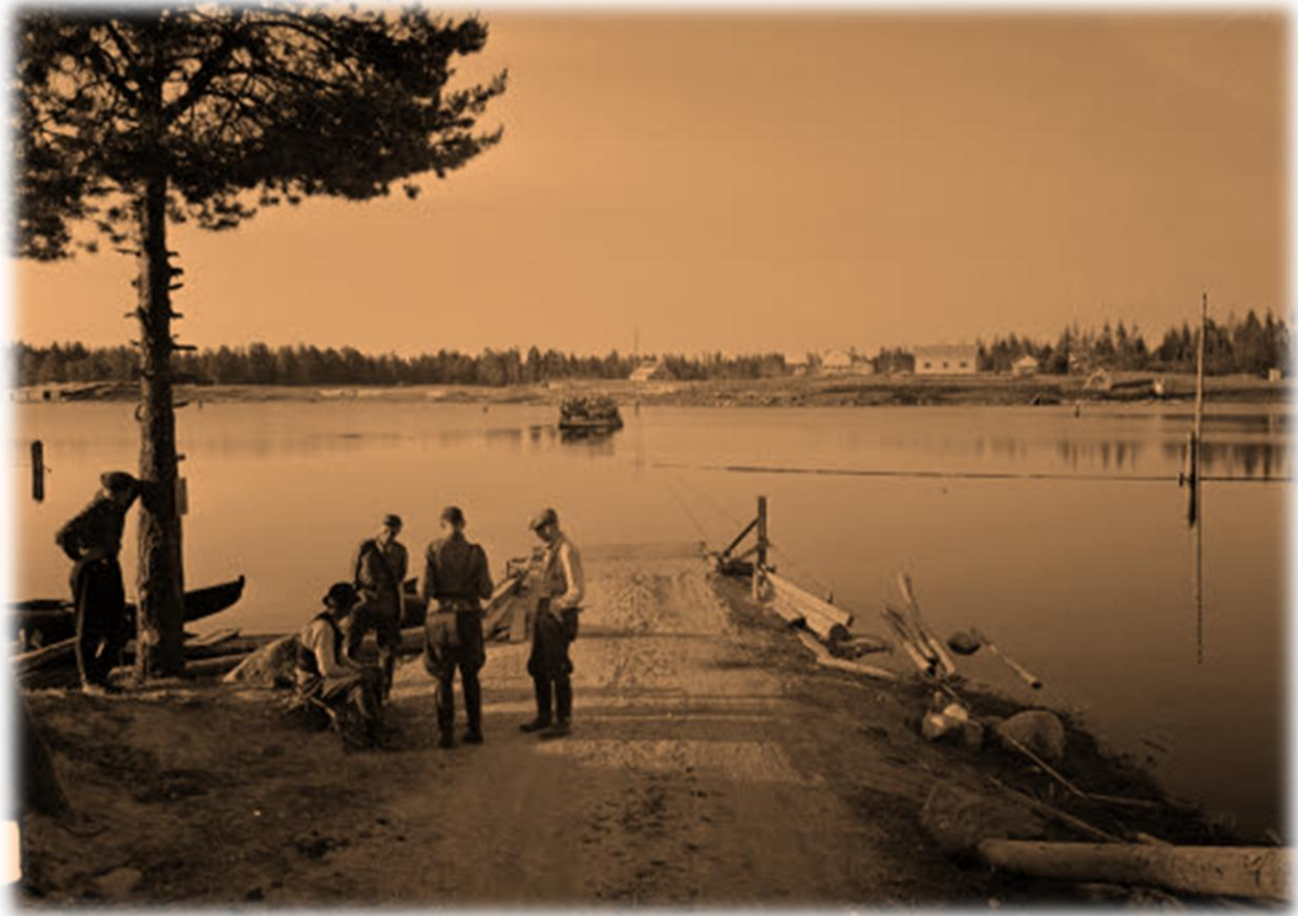
Oinassalmen lossi jatkosodan alla kesällä 1941