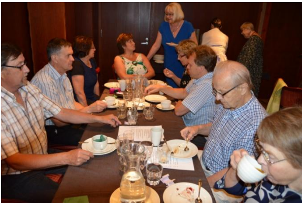
Miikkulanvaaran Kettusia kokouksessa