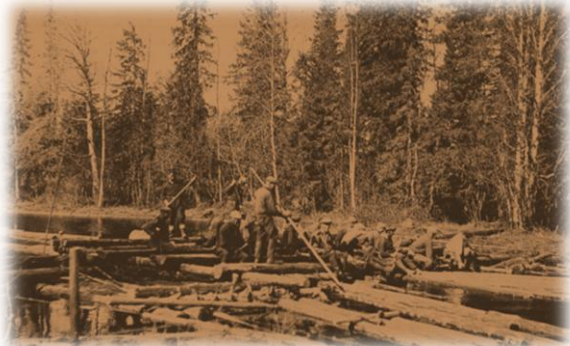
Uittoporukka uittamassa Varpajoella 1930-luvulla

Savotoilla oli 1930-luvulla Ilomantsilaisten miesten lisäksi ”jätkiä” eripuolilta Pohjois-Karjalaa. Osa miehistä oli ns. kulkujätkiä, jotka tekivät töitä paikassaan vain yhden talven ajan.