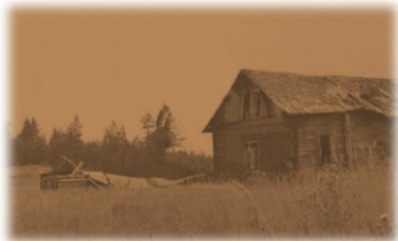
Ilajan Ruukinpohjan kruununtorppa