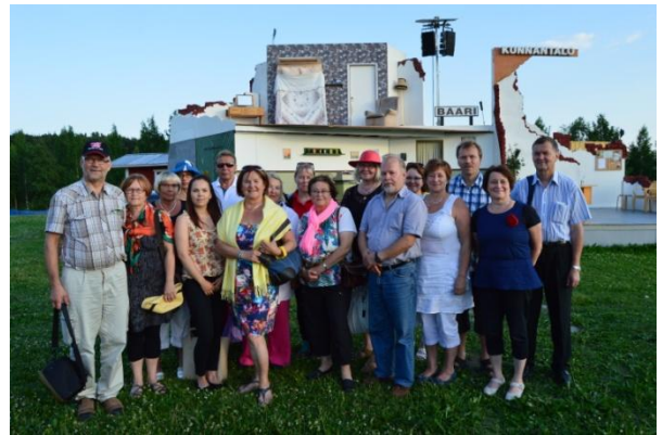
Sukumme jäseniä kesäteatterissa