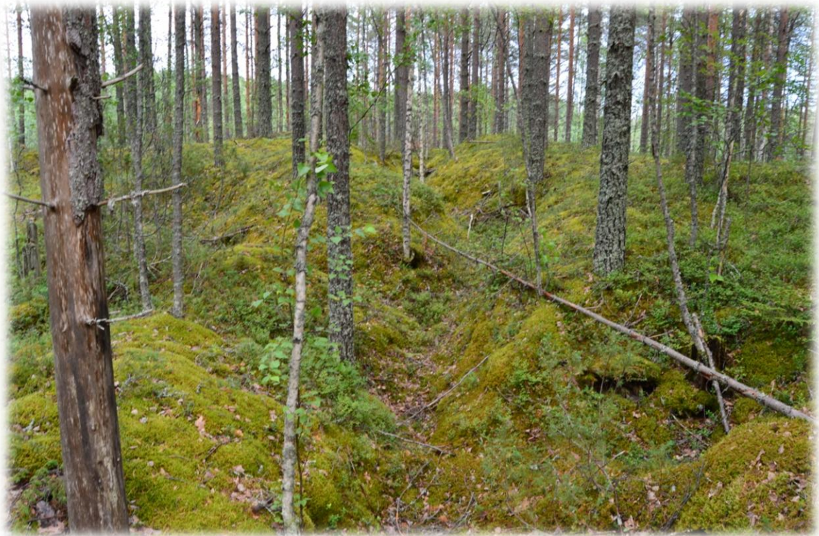
Sama paikka 73 vuotta myöhemmin 21.7.2013