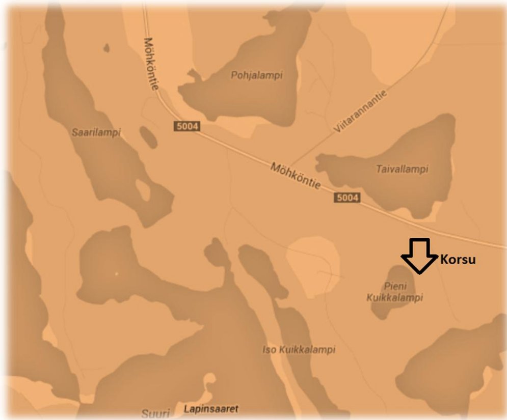
Karttapiirros edellisen sivun korsunpaikasta