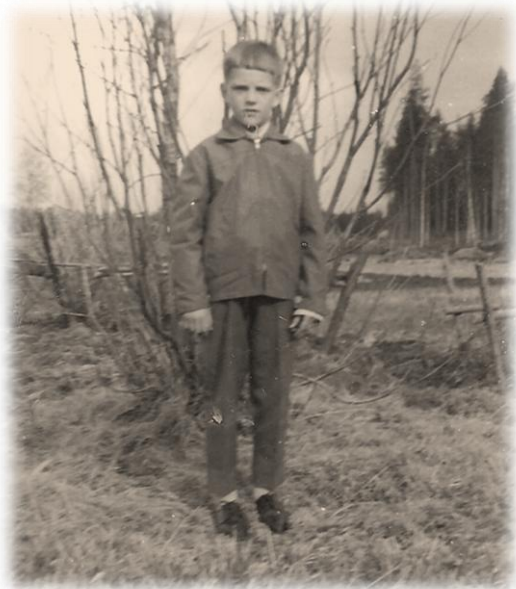
Allekirjoittanut lähdössä kevätjuhlaan v. 1963