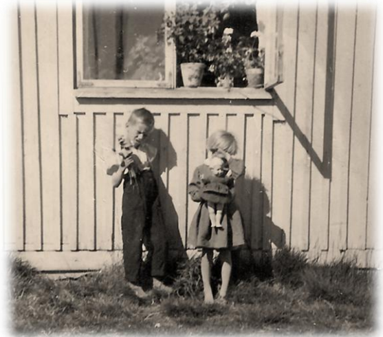
Ensimmäinen kesälomapäivä v.1963