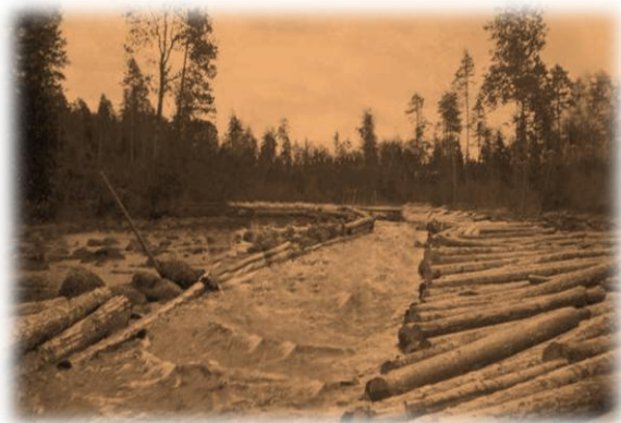
Itkajärvestä vesi virtaa Valkkijokea pitkin Koitajokeen