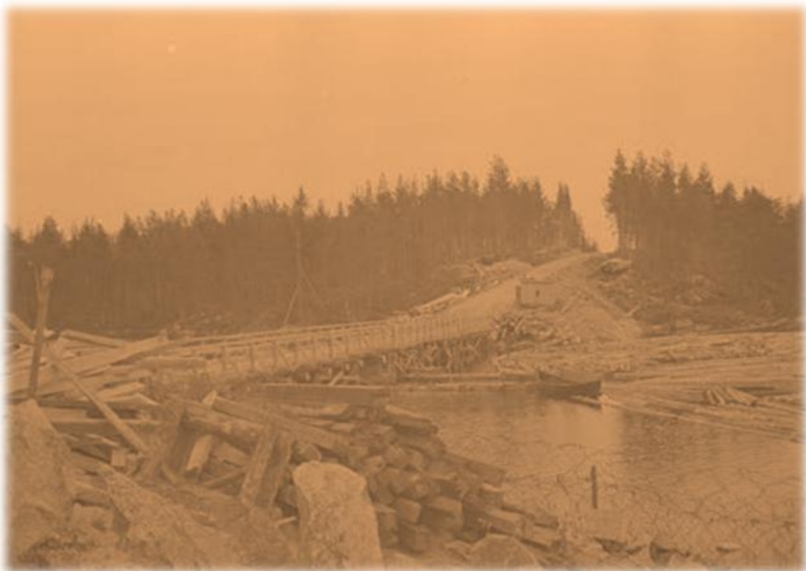
Oinassalmen pioneerien tekemä silta jatkosodan aikana (Kuva Möhköön päin)