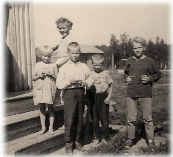
Kettusen perhettä kesällä 1963

aamulla. Perjantaina heräsin postiauton tuttuun pärinään, mutta siihen kyytiin en ehtinyt. Kysyin enolta, miksi et herättänyt minua ajoissa? Eno vastasi, että kulkeehan se auto huomennakin. Periaatteena minulla on ollut lapsesta saakka, että mitä luvataan, se pidetään. Puin päälleni ja sanoin, että lähdän jalan kotiin. Matkaa Haukivaarasta Kuuksenvaaraan kertyi parisenkymmentä kilometriä. Eno yritti estellä minun lähtöni, mutta olin päätökseni tehnyt. Itku kurkussa lähdin taipaleelle ja käveltyäni runsaan tunnin ajan kotia kohti, takaa tuli kuplavolkari, joka pysähtyi kohdalleni. Mies kysyi, minne pojalla on matka? Vastasin miehelle, että olen menossa kotiin Kuuksenvaaraan. Mies käski hypätä kyytiin ja kyseli matkan tarkoitusta. Möhkön risteyksessä jäin kyydistä ja kävelin loppumatkan kotiin. Kotona ihmeteltiin, millä autolla olin tullut kotiin.