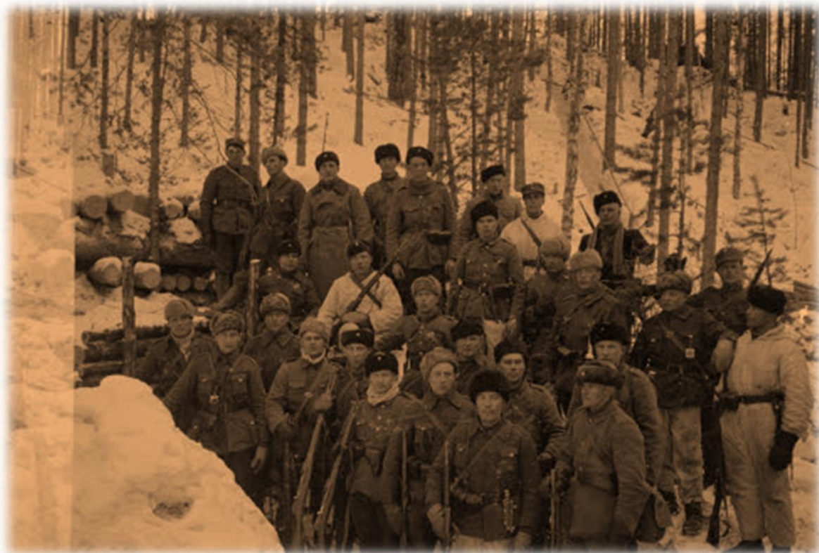
Jalasjärven miehiä helmikuussa 1940 Pienen Kuikkalammen rannalla