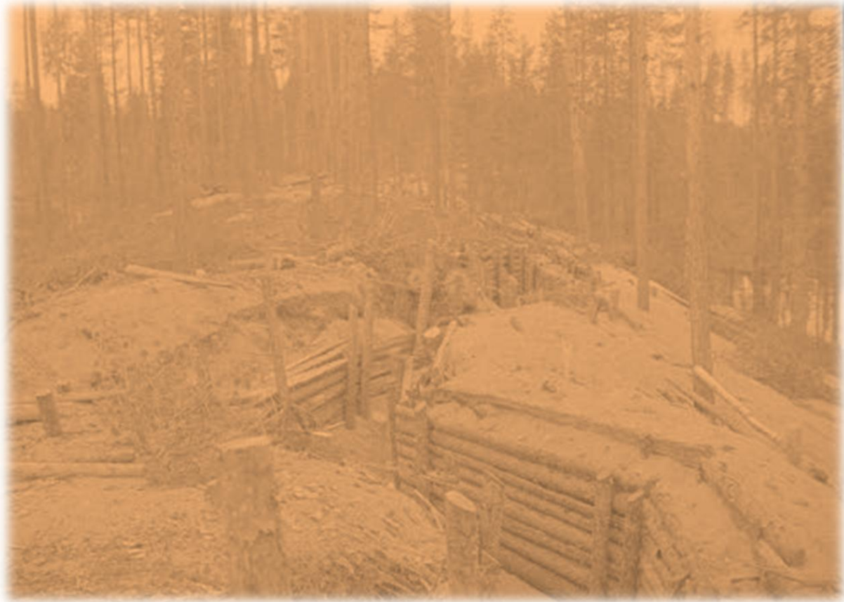
Oinassalmen taisteluhautoja talvisodan jälkeen SA-kuva