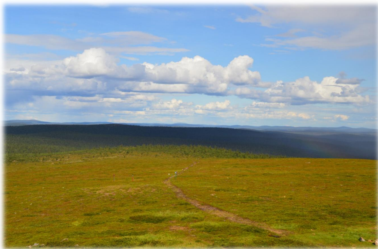
Suomen kesä oli kaunis, lämmin ja sateinen vuonna 2013