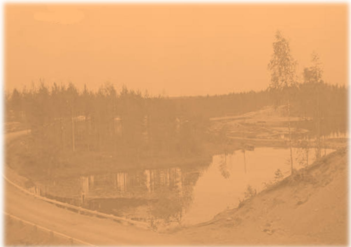
Oinassalmi jatkosodan alkuvuosilta (Ilomantsista päin) SA-kuva