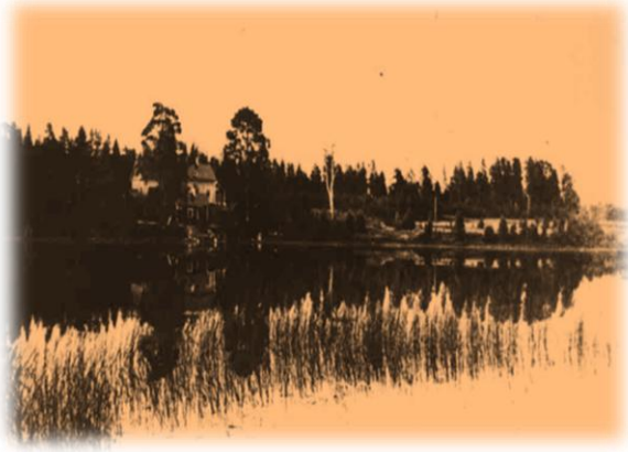
Salmijärven vartioasema sijaitsi luoteisrannalla

vuonna 1938. Se sijaitsi Salmijärven luoteiskolkassa. Salmijärven vartion tehtäviin kuului vartioita pientä osaa Ilomantsin puoleista rajaa Liusvaarasta Suojärven rajalle saakka. Vartioaseman vartiointialue jatkui Suojärven puolella Naistenjärven vartioaseman rajalle saakka.