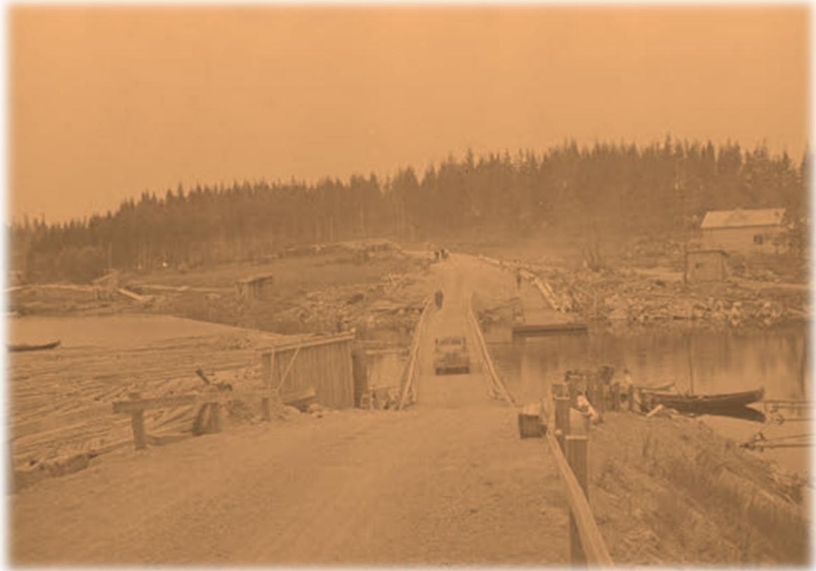
Oinassalmen silta Möhköstä päin kuvattuna jatkosodan alkuvuosina (Möhköstä päin)