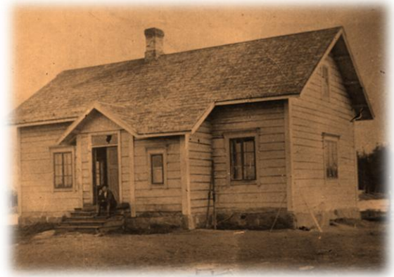
Hurskaisten talo Kuolismaassa

linja-autoissa matkustavien rajapassit tarkastettiin Kuolismaassa. Muut Kuolismaan tienkäyttäjät tutkittiin pistokokein.