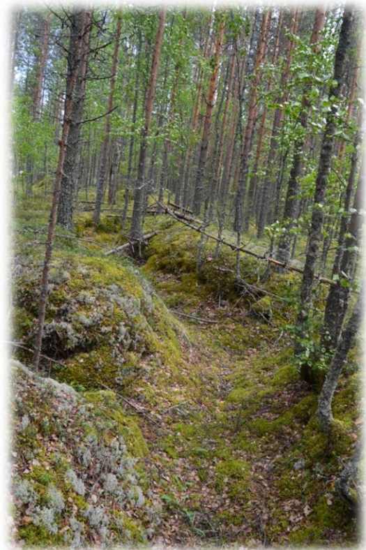
Taivallammen taisteluhautaa talvisodan aikana SA-kuva ja 73 vuotta myöhemmin