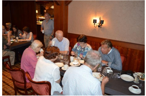
Miikkulanvaaran Kettusten jälkeläisiä kahvilla