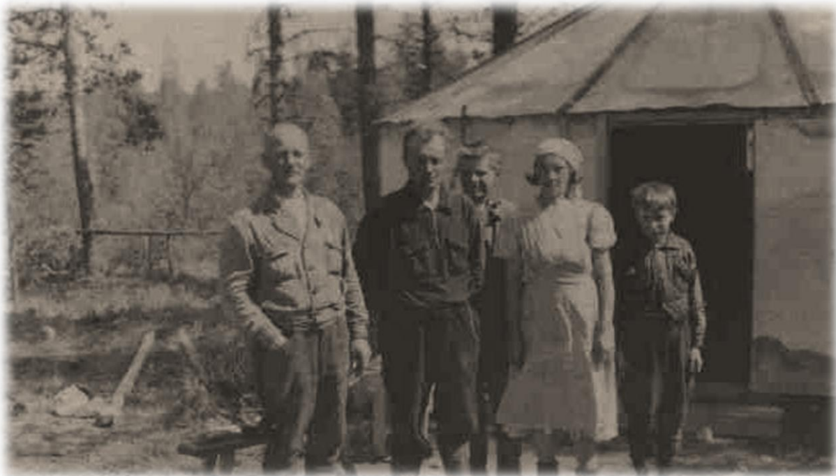
Väliaikainen asumus Jakunvaaralla v. 1942 tai 1943