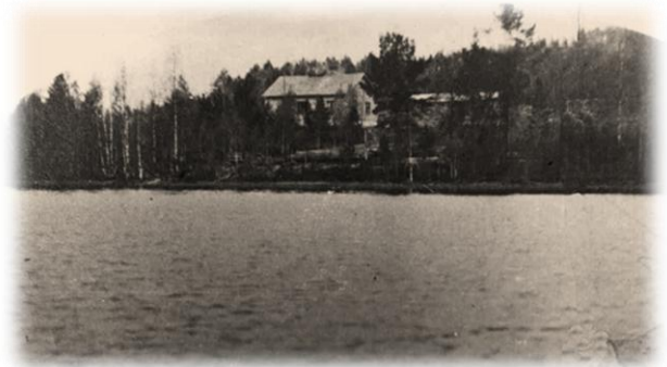
Pahkalammelle rakennettiin rajavartioston vartiotupa

Luostarin asuintalosta etelään suuntaan sijaitsi luostarin kalmisto, johon munkit saivat viimeisen leposijansa. Kalmistoon haudattiin myös nunnia, joita eleli Pahkalammen vastarannalla sijaitsevassa nunnaluostarissa. Molemmilla oli kuitenkin oma osastonsa kalmistossa.