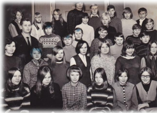
Koulukuva vuodelta 1969

Eräänä aamuna linja-autoa odottaessa huomasi, että täysi keskiolutkori oli piilotettu maitolaiturille. Tiesimme, että kori oli erään juopottelevan naapurin. Joimme pulloista yhden tyhjäksi. Pian meitä alkoi vaiivata tarve käydä pissillä. Sanonta "Joukossa tyhmyys tiivistyy" oli totta sinä aamuna. Teimme tarpeemme tyhjään olutpulloon ja laitoimme korkin takaisin paikoilleen. Seuraavana aamuna, linja-autoa odottaessamme, tuli naapurin juopotteleva mies kyselemään meiltä, "työkö kussitta minun olutpulloon?" Sanoimme, että miksi hän meitä epäilee, olihan laiturilla muitakin linja-autoa odottavia. "Se on menoa kusijoille, jos saan heijät kiinni" sanoi mies lähtiessä.