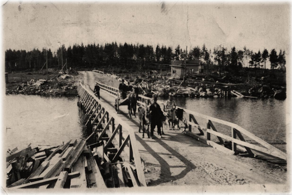
Kuolismaan evakot Oinassalmella 1942 tai 1943