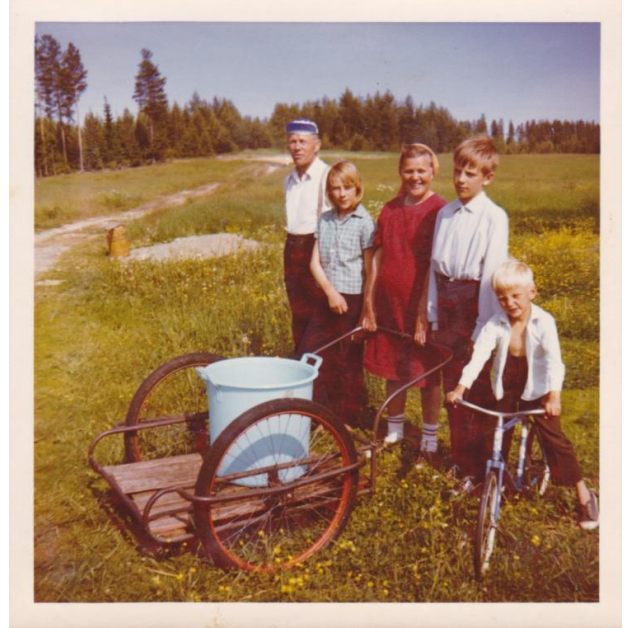
Saunavesi kulkee kahdella pyörällä elokuussa 1969