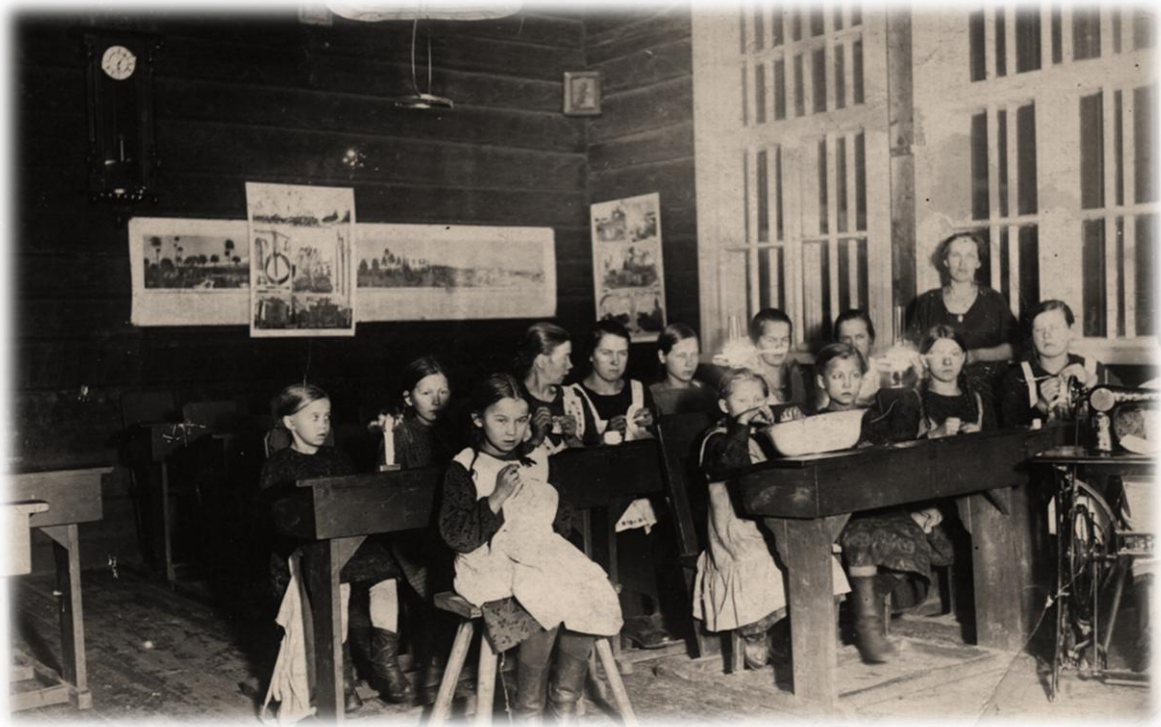
Kuolismaan koulukuva 1930-luvulla