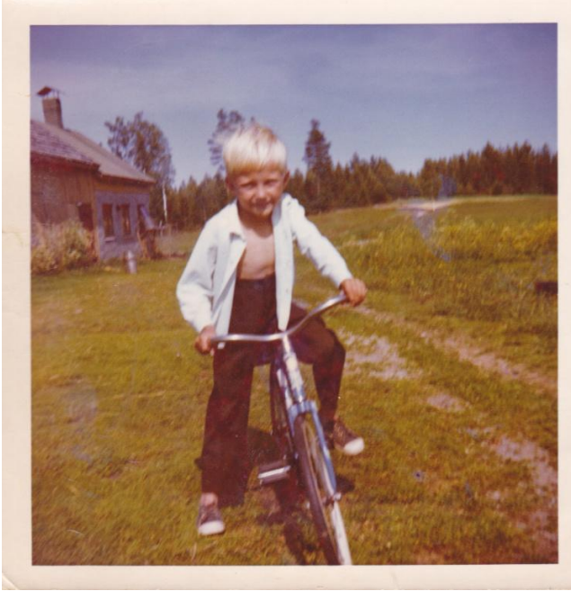
Pikkuveljen ensimmäiset pyöräilyharjoitukset 1969