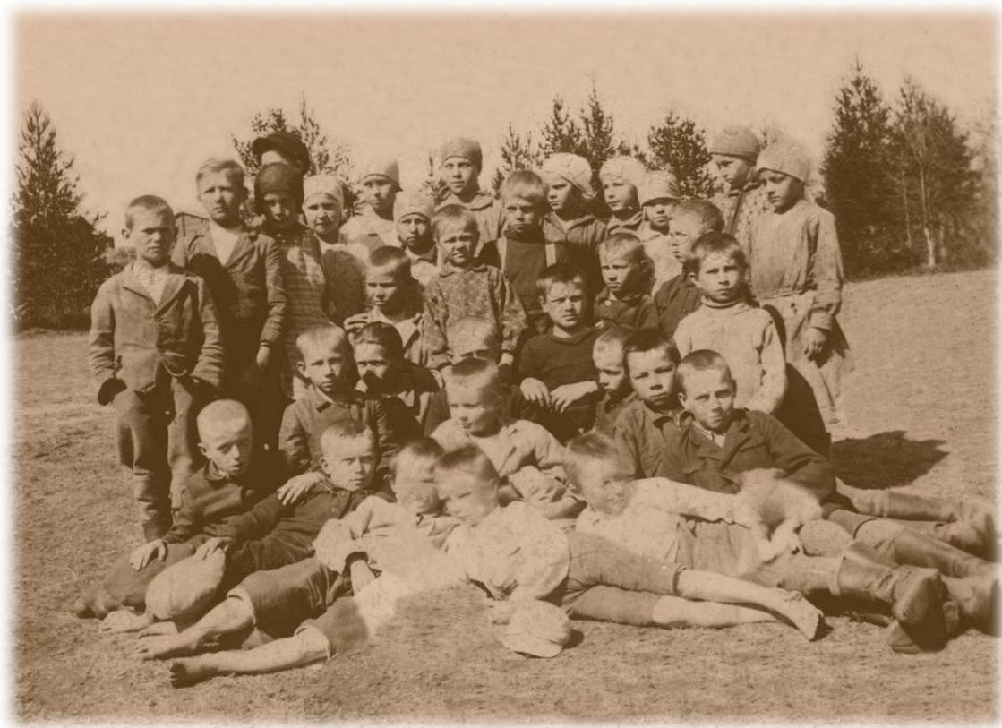
Kuolismaan koulukuva v. 1935, takana Matinväärän taloja