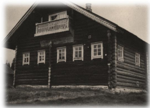
Megrin vanhauskoisten luostari