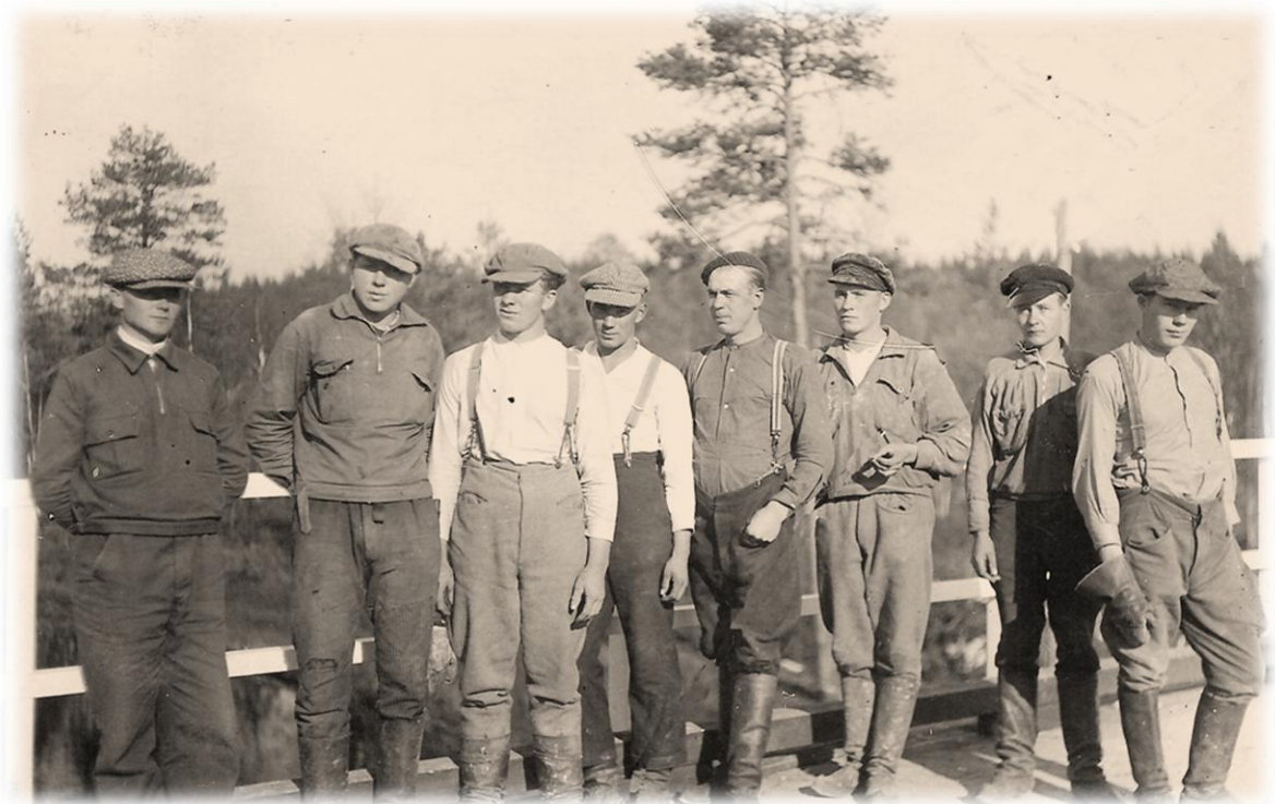
Luovenjoen sillan rakennusporukka sillalla v. 1938