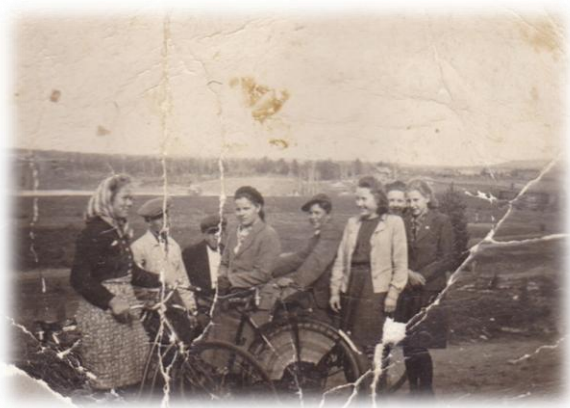
Ilomantsin evakkoja Varpaisjärvellä 1944

Kuuksenvaaraan muutti sodan jälkeen kymmeniä itäkylien asukkaita. Heistä mainittakoon Kuolismaan, Miikkulanvaaran ja Lutikkavaaran Kettuset. Kuolismaasta ja sen ympäristökylistä Muikut, Kanniset, Piiraiset, Lyhykäiset, Ahposet, Kuivalaiset ja Kuosmaset. Melaselästä muutti Härköset, Purmoset ja Palviaiset. Ontronvaaralta muutti Ikoiset ja Jakunvaaralta Timoskaiset. Liusvaarasta ja Kuolismaasta muutti Martiskaiset. Vuottoniemeltä muutti Potkosen perhe.