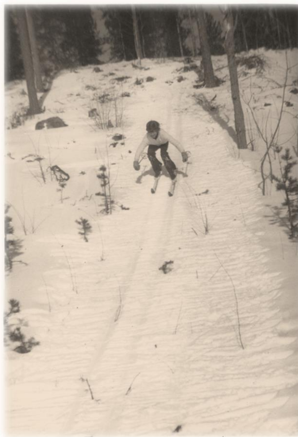
Särkkätiellä hiihtämässä keväällä 1972

savotasta siemensavottaan Haravapurolle. Muutimme asuinpaikkamme Käenkosken vanhalle kämpälle. Kesäkuun alku oli kuumaa aikaa ja päivittäin lämpötila kohosi lähelle hellelukemia. Työnteko lämpimässä suomaastossa itikoiden syötävänä ei ollut herkkua nuorelle pojalle. Serkkupojat ihmettelivät, kun kerroin heille, että olen menossa ammattikouluun. He sanoivat, elämä on helpompaa täällä metsien keskellä. Talvisin aika vierähtää savotoilla, kevät ja alkukesät taimi- ja siemensavotoilla. En nähnyt silloin poikien haaveissa tulevaisuutta. Eivätkä he itsekkään jääneet myöhemmin metsätöihin.