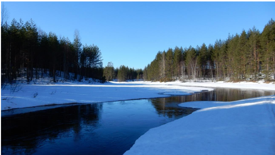
Huhtikuu, Lyöropuro Kuuksenvaarassa