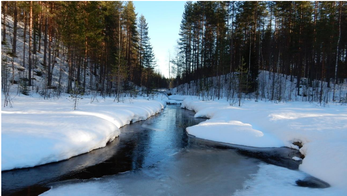
Maaliskuu, Majavapuro Kuuksenvaarassa