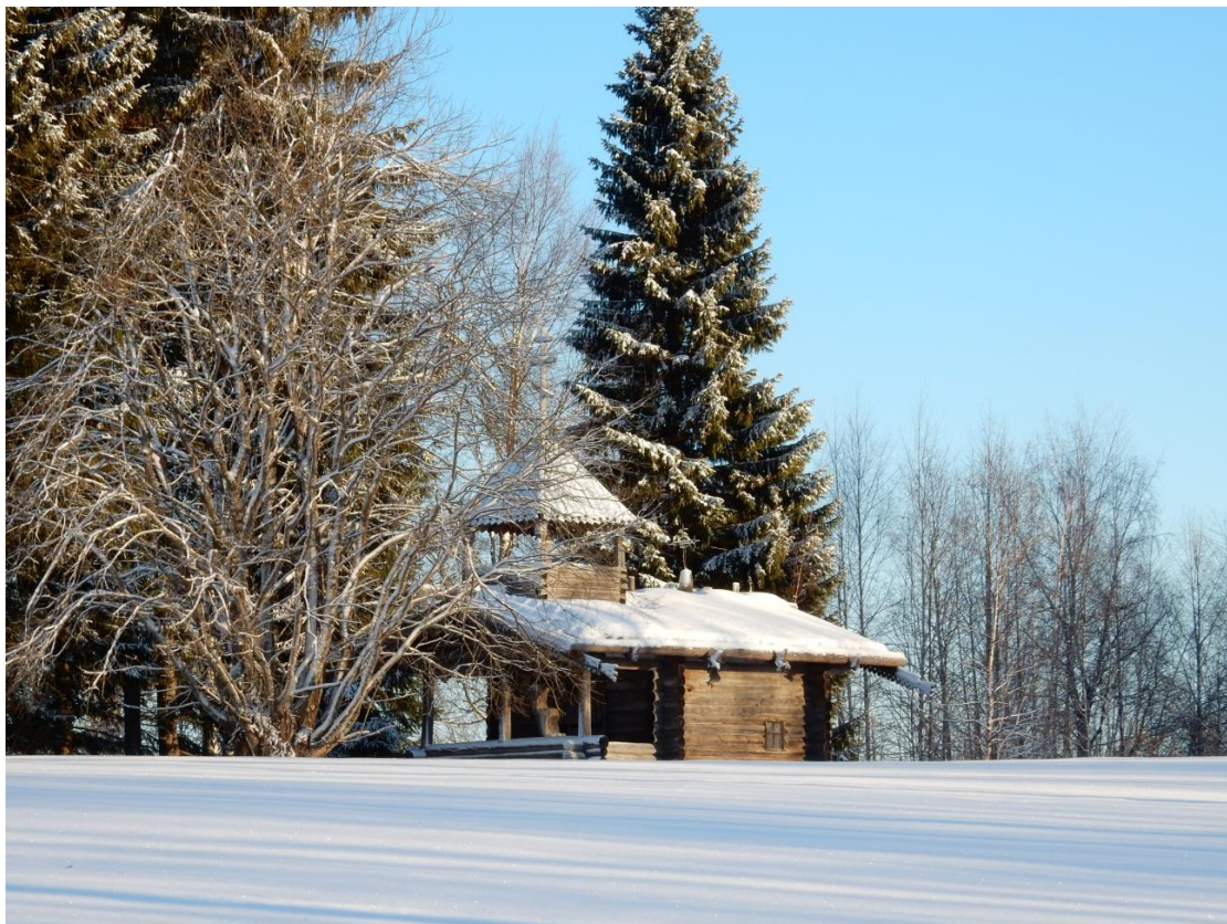
Helmikuu, Tsasouna Parppeinvaaralla