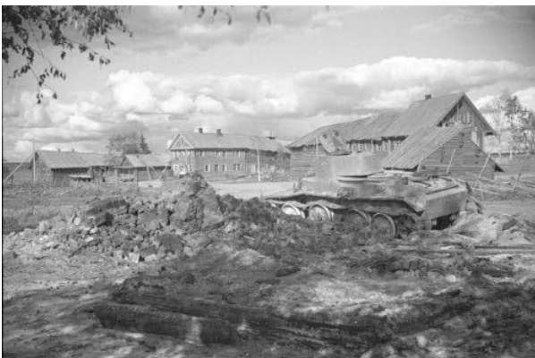
Kotkatjärven kylä 11.9.-41 SA-kuva

Toisen pataljoonan sotilaat marssivat 13. syyskuuta Kaskanan erämaakylän eteläpuolella kulkevaa Vašinkajokea (Vaaseninjoki) seurailevaa tietä. Edellisenä viikkona oli satanut vettä useana päivänä ja tiet olivat liejuisia ja pohjattomia. Tiestö vaati pataljoonaa seuraavalta kuormastolta suuria ponnistuksia. Hevoset vetivät suuria kuormia, joissa oli ammuksia, aseita, teltoja ja ruokatarvikkeita. Autoja jouduttiin työntämään tai vetämään pahimpien paikkojen ohi. Edellisenä päivänä komppania oli vallannut Kotkatjärven kylän ja nyt edettiin kohti Kaskanan kylää.