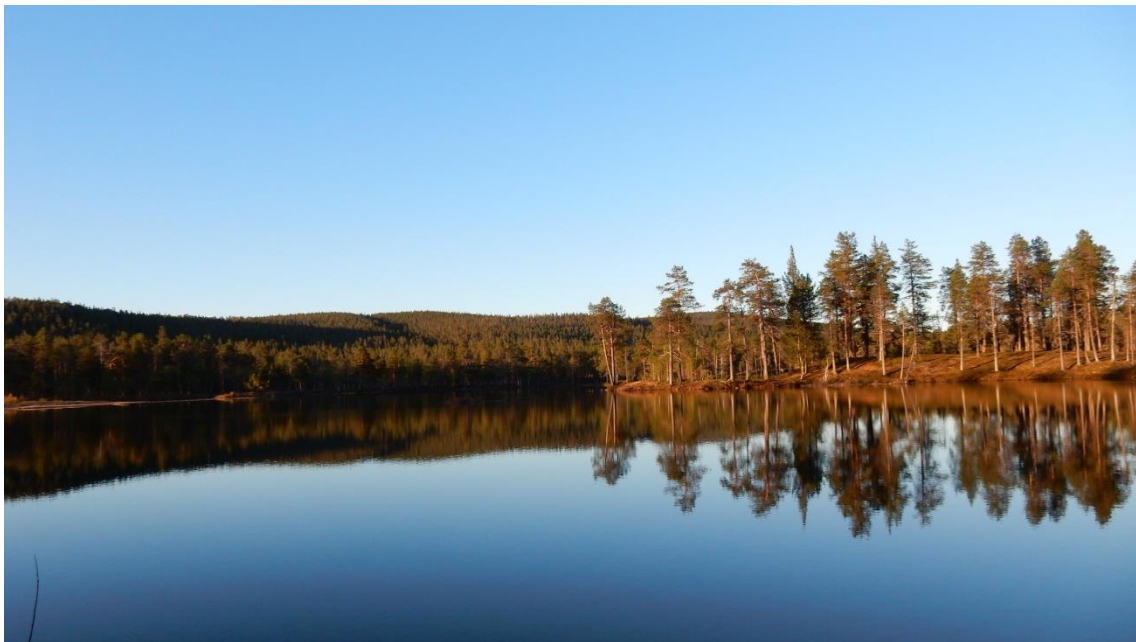
Kesäkuu, Lankojärvi aamuyöllä