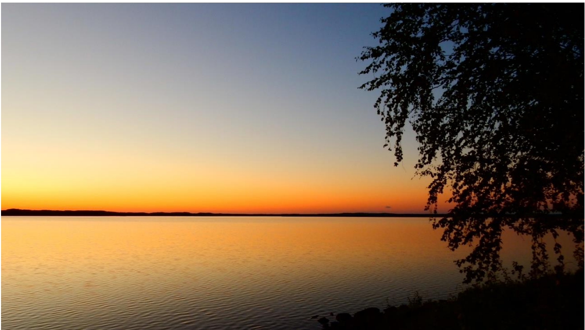
Elokuu, Kasinjärvi auringonlaskun aikaan