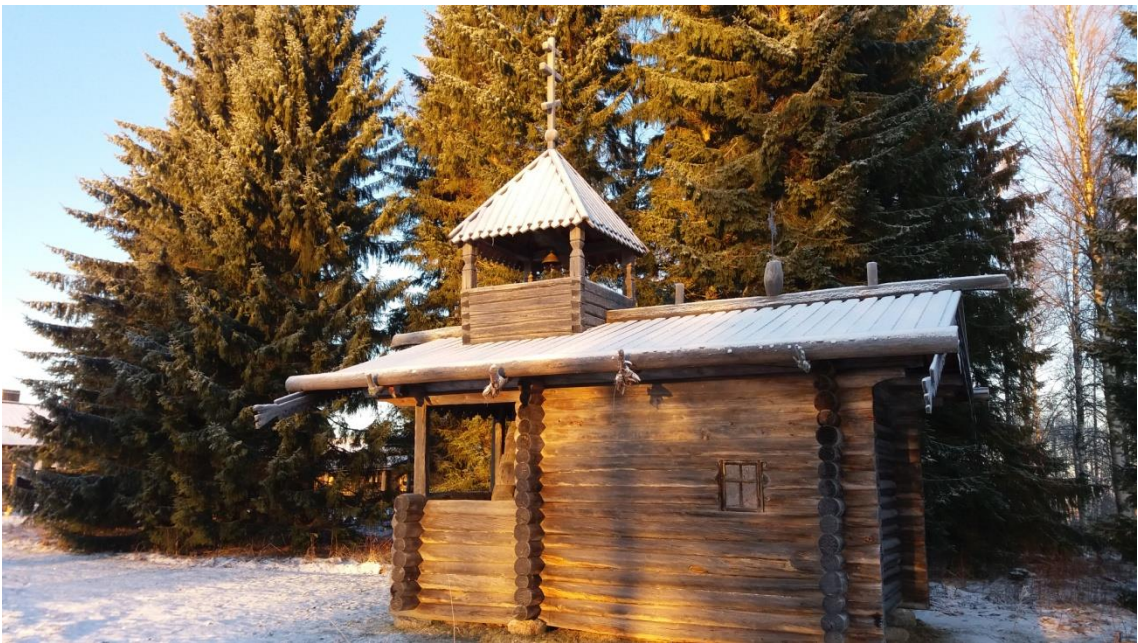
Joulukuu, Parppeinvaaran tsasouna