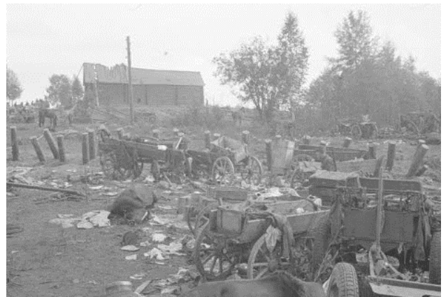
Kristianin kylä 15.9.-41

Nirkan kylästä kolmas pataljoona siirtyi kokonaisuudessaan Pyhäjärven eteläpuolelle. Taistelut jatkuvat seuraavana päivänä Kristianin kylässä ja Simanistossa pataljoona yhtyi JR 30 joukkoihin. Osastot lähtivät ajamaan takaa Pyhäjärven Simanistosta paennutta venäläistä kolonaa, joka joutui vaikeuksiin pehmeällä ja kelirikkoisella tiellä.