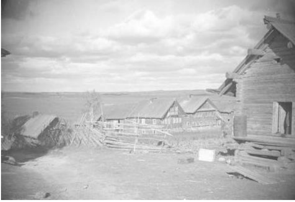
Simaniston kylä

Toisen pataljoonan sotilaat marssivat 13. syyskuuta Kaskanan erämaakylän eteläpuolella kulkevaa Vašinkajokea (Vaaseninjoki) seurailevaa tietä. Edellisenä viikkona oli satanut vettä useana päivänä ja tiet olivat liejuisia ja pohjattomia. Tiestö vaati pataljoonaa seuraavalta kuormastolta suuria ponnistuksia. Hevoset vetivät suuria kuormia, joissa oli ammuksia, aseita, teltoja ja ruokatarvikkeita. Autoja jouduttiin työntämään tai vetämään pahimpien paikkojen ohi. Edellisenä päivänä komppania oli vallannut Kotkatjärven kylän ja nyt edettiin kohti Kaskanan kylää.