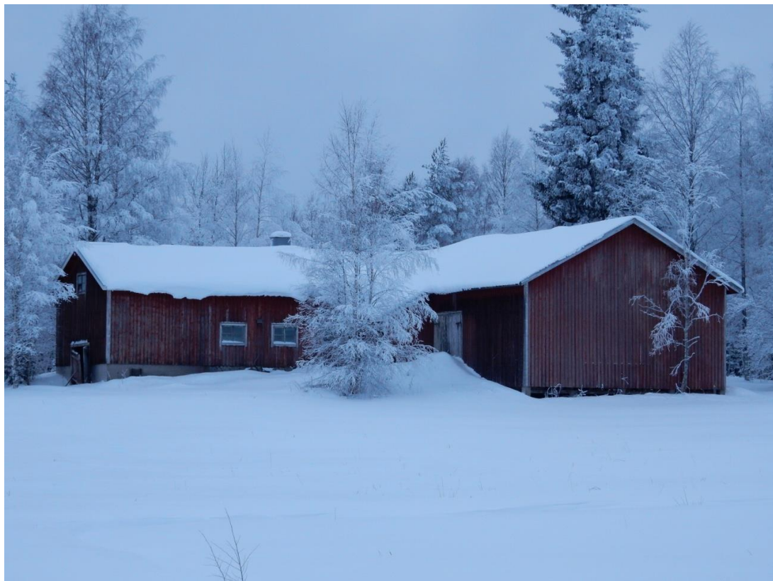
Tammikuu, vanha lato Riihijoella