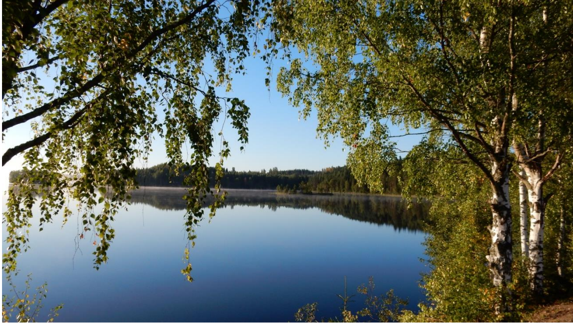
Syyskuu, Yläjärvi aamulla kello 7.00