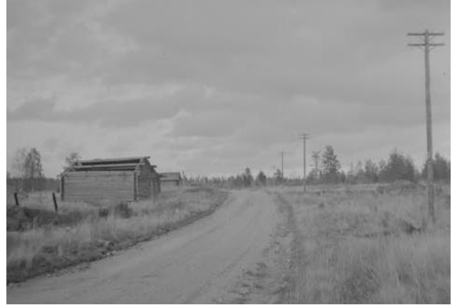
Nirkan kylä 12.9.-41