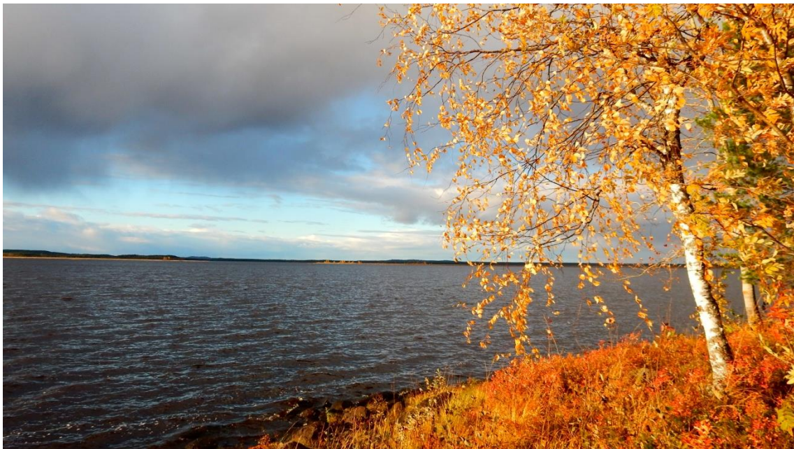
Lokakuu, Kasinjärvi ilta-auringonpaisteessa