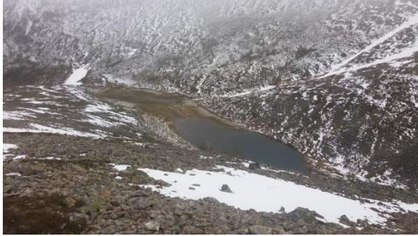
Paratiiskuru kesäkuuisena aamuna

Olen aikuisiässä matkustellut lähes joka kesä joko Suomessa tai ulkomailla. Rakka harrastus viimevuosien aikana on ollut kuitenkin Lappi, jossa lähes joka kesäkuu olen käynyt vaeltamassa tunturissa, samalla yöpynyt autiotuvissa tai varaustuvissa. Tänä kesänä kävin Itä-Lapin tuntureilla ja vietin siellä muutaman päivän lumisessa ja kosteissa olosuhteissa. Ohessa on muutamia kuvia tämän kesän Lapin vaellukseltani.