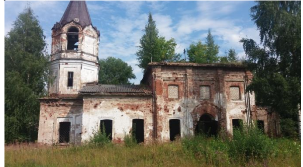
Minovan kirkko, alla Minovan kylä

vanhoja kuvia, joita voisi verrata nykypäivän rakennuksiin. Kylän kirkko oli muutama sata metriä Mozolinon ja Nikitinskan kyliin menevän tien varressa, mutta se oli huonossa kunnossa. Kattojen, ovien ja Ikkunoiden uusiminen voisi säästää rakennusta muutamia kymmeniä vuosia eteenpäin!