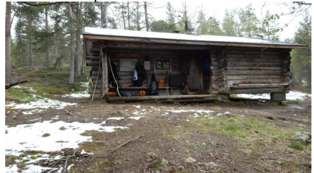
Sarviojan autio- ja varaustupa