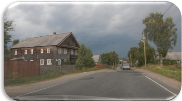
Kuvia Äänisen rannan Vepsäläiskylistä kesällä 2016