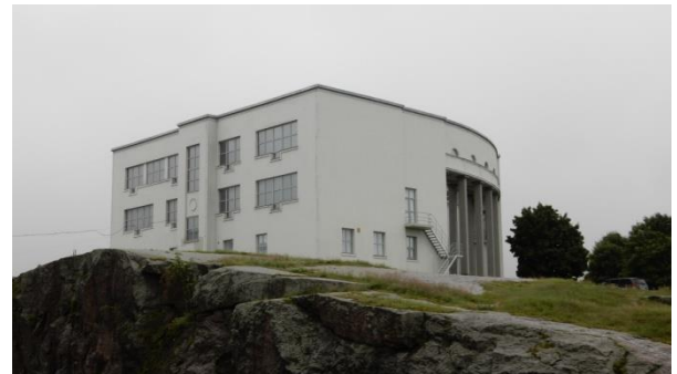
Vanha Viipurin taidemuseo