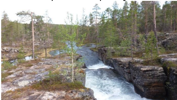
Sotajoki Sotajoenvaaran alla