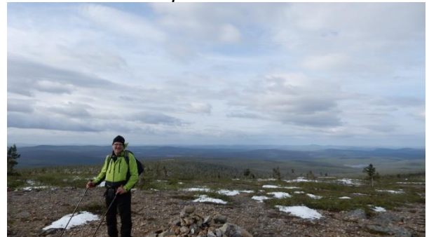
Kaarnepäällä illalla kello 18.00