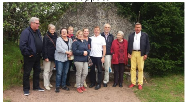
Sukuseuran jäsenet Ihantalassa