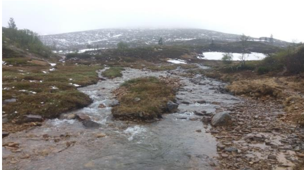
Tunturipuro Uomapään juurella