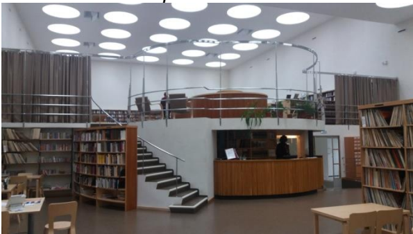
Aallon kirjasto Torkkelinpuistossa