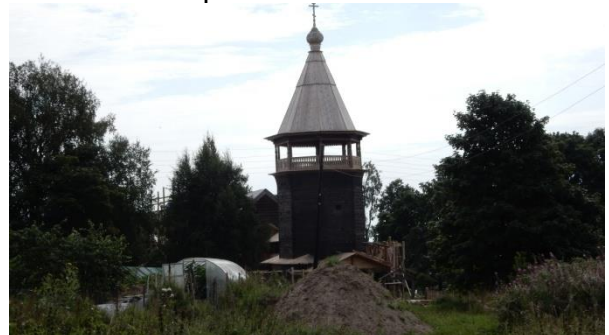
Stetšlin (Kallion) kirkko

Seuraavina kylät olivat Kalajoki ja Toinen joki, jotka olivat samantyyliisiä, kuin Vehkaoja ja Soutjärvi. Kallio eli Steslin kylästä, löysimme sota-aikana pystyssä olleen kirkon kylän mäen päältä. Kirkko näytti läheltä katsottuna samannäköiseltä kuin Himjoen kirkkorakennus, mutta matkamme aikana kirkon katto oli purettu pois ja kellotapuli oli saanut jo uuden katon. Hienoa, että joitakin kirkkoja kunnostetaan tulevien sukupolvien ihailtaviksi.