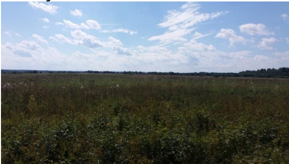
Haaksin ja Bunkkerin tukikohdat

kosodan aikana 8./JR 9. joukot. Nyt Bunkkerin tukikohta oli kadonnut sota-ajan jälkeen maatalousmaan alle. Ihmettelin ensimmäistä kirjaa tehdessä, miksi Koromy-slovassa, Voseroksassa ja Simanovassa kaatui paljon suomalaisia tarkka-ampujien luodeista. Tukikohdat sijaitsivat todella laajan peltoaukean keskellä ja sieltä näkyi hyvin aina Ostan kylään saakka. Tarkka-ampujilla oli siis hyvä näkyvyys ja ampuja on voinut tähyttää etulinjaa kauempaakin takalinjoilta.