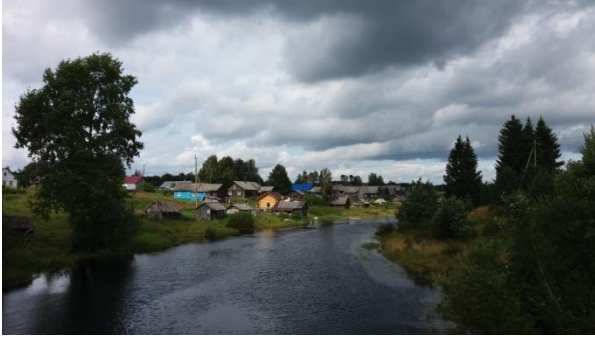
Kolatselän kylä, lähellä Vieljärveä