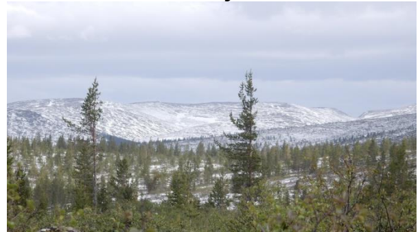
Tunturin huipulla oli lunta 20 cm