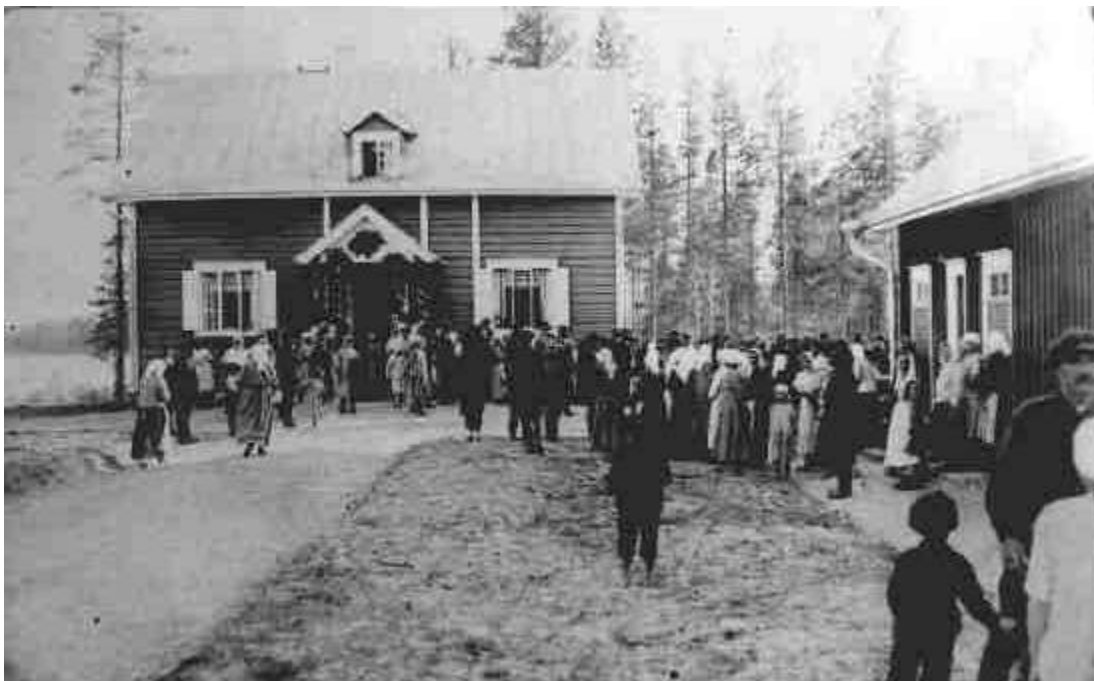
Sairasmajan vihkiäiset 3.7.1926