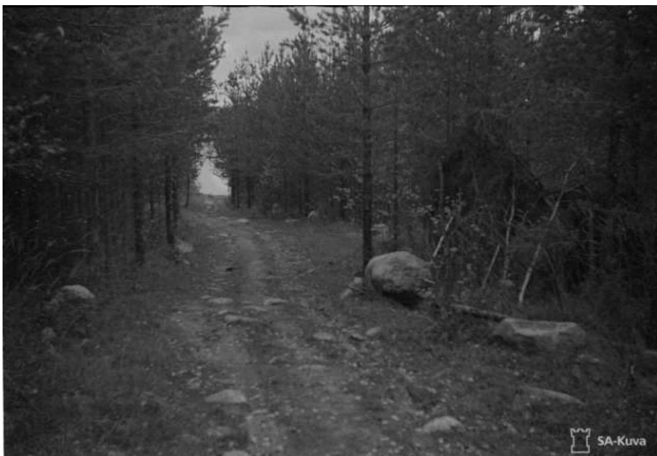
Yläjärvelle johtava tie 1943