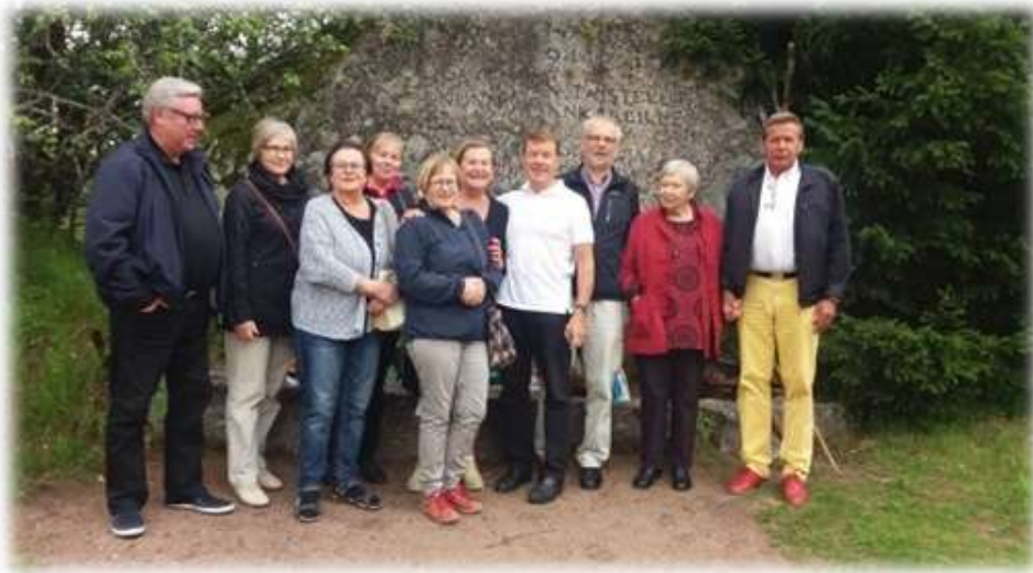
Kesällä 2016 Sukuseuran matka Viipuriin ja Ihantalaan