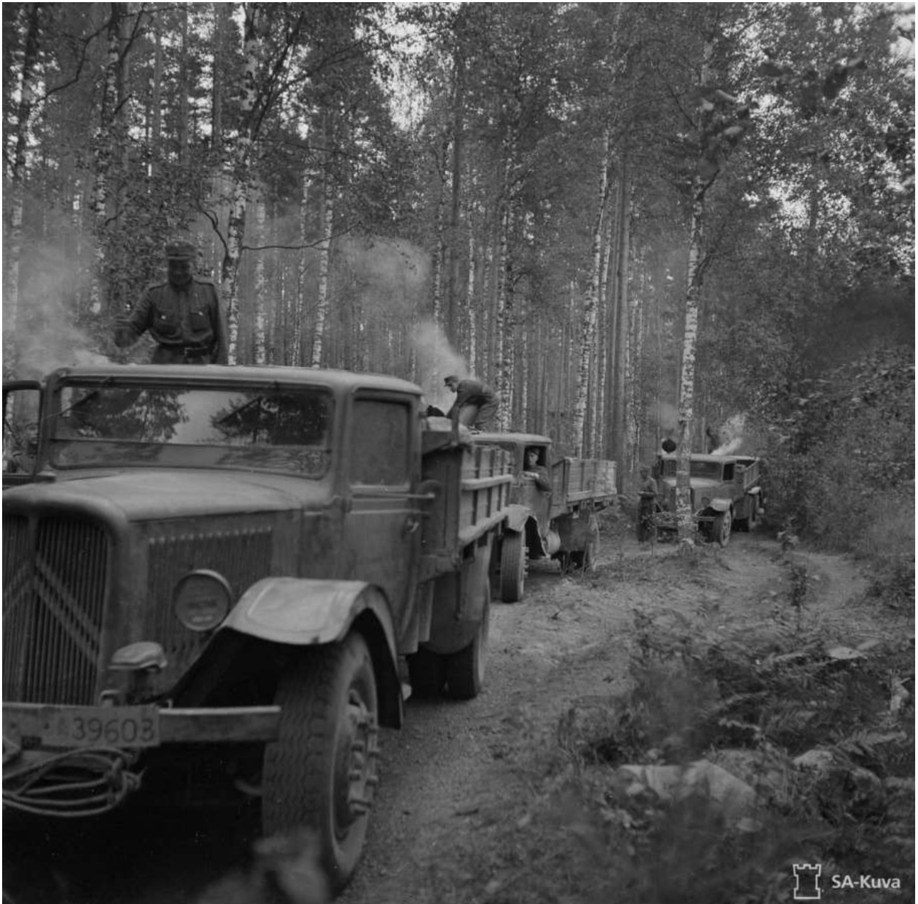
Autokolona Karjalan korvessa kesällä 1944

koko partisaaniporukka olivat erittäin taitavia ja myös häikäilemättömiä, koska partisaanien johtaja tapatti kaikki haavoittuneet miehet.