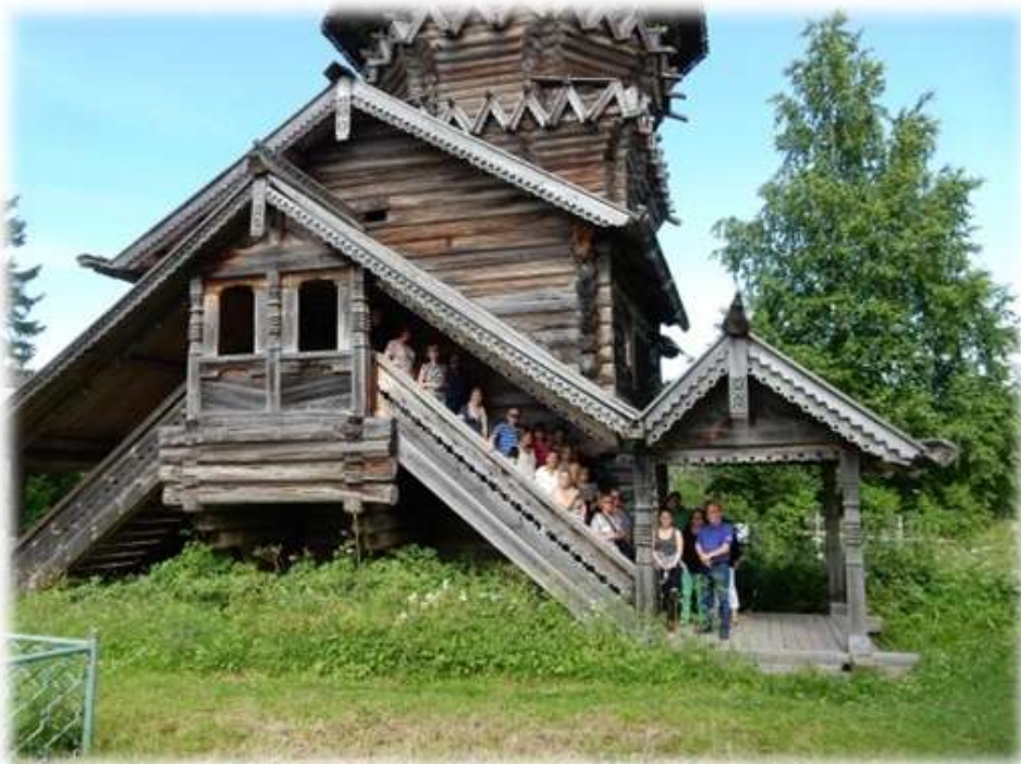
Kesällä 2017 Sukuseuran matka Äänisen rantakylään