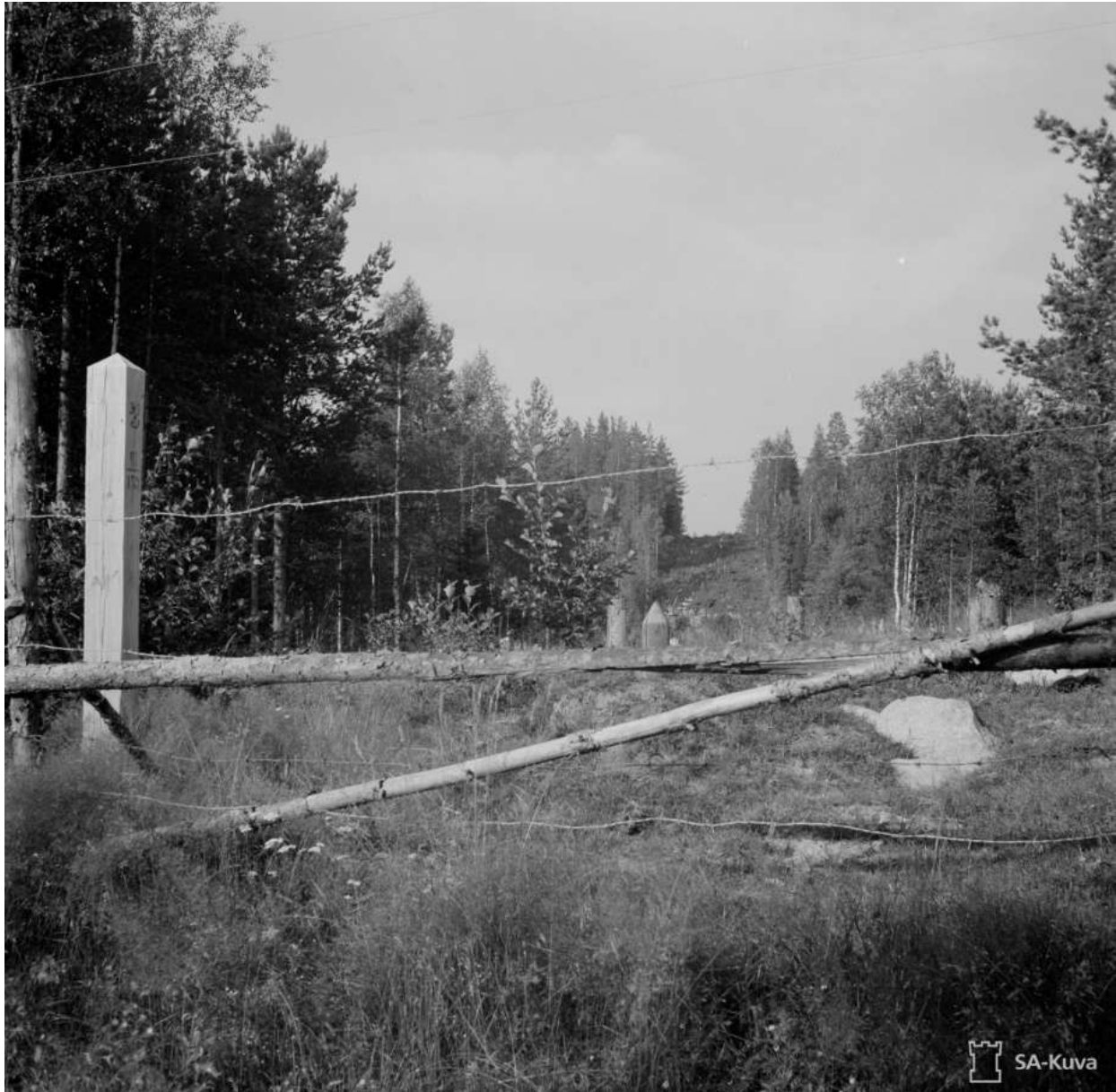
Rajalinja Ruhovaarasta Ilomantsin suuntaan kesällä 1941

Rajakiistoista mainittakoon Ilomantsin osalta seuraavien kylien kohtalot. Melaselänkylä olisi jäänyt Suomelle Moskovassa solmitussa rauhassa, mutta paikallinen rajavaltuutettu oli sitä mieltä, että se jää Neuvostoliiton puolelle. Samoin hän vaati Saarivaaraa, Mannervaaraa, Mutalahtea ja Longonvaaraa Neuvostoliitolle. Neuvotteluissa päästiin kompromissiin ja em. kylät jäivät osittain Suomen puolelle. Myös suuret teollisuustaaajat kuten Enso ja Wärtsilä siirtyivät vastoin alkuperäistä sopimusta Neuvostoliitolle. Kesällä 1940 Suomalaiset aloittivat suururakan ja raivasivat rajalinjat syksyyn 1940 mennessä rajalinjat