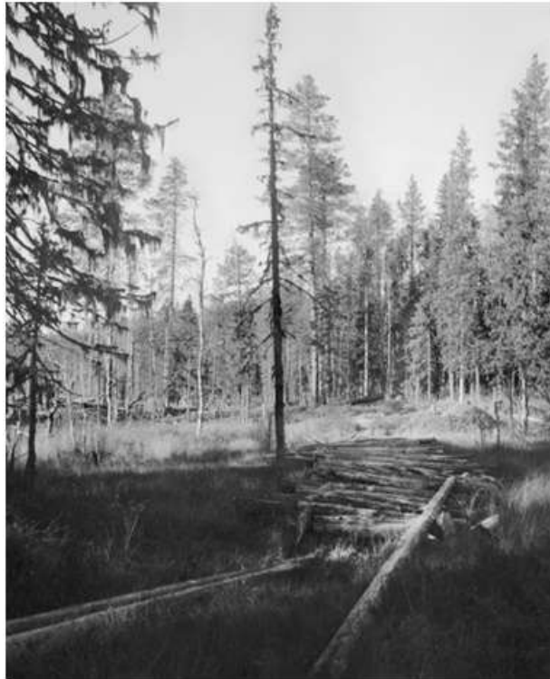
Liusvaaran ja Salmijärven välinen "tie" 1930-luvulla