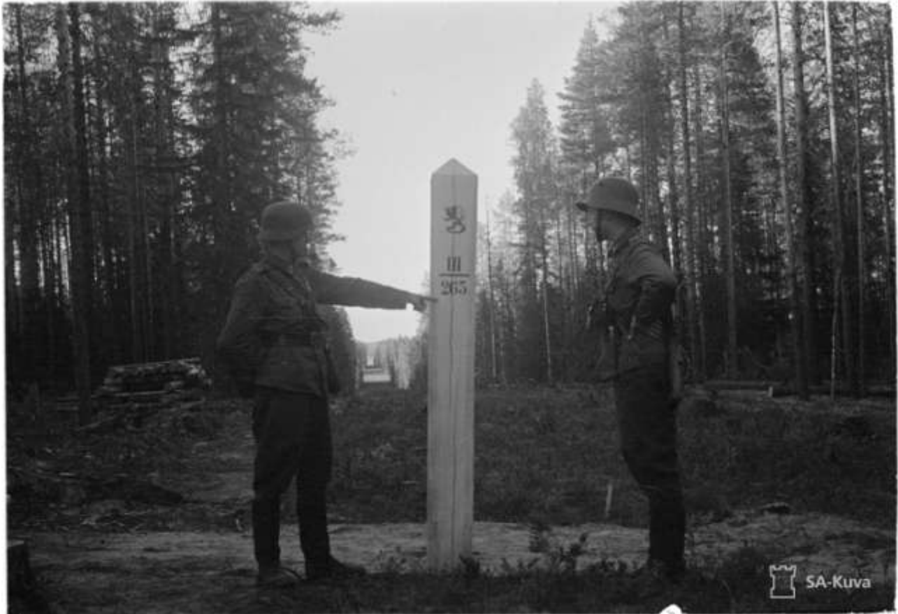
Rajalinja Ilomantsissa kesällä 1941

kuvissa näkyvään kuntoon. Rajalla työskenteli silloin tuhansia nostomiehiä ja varusmiehiä.