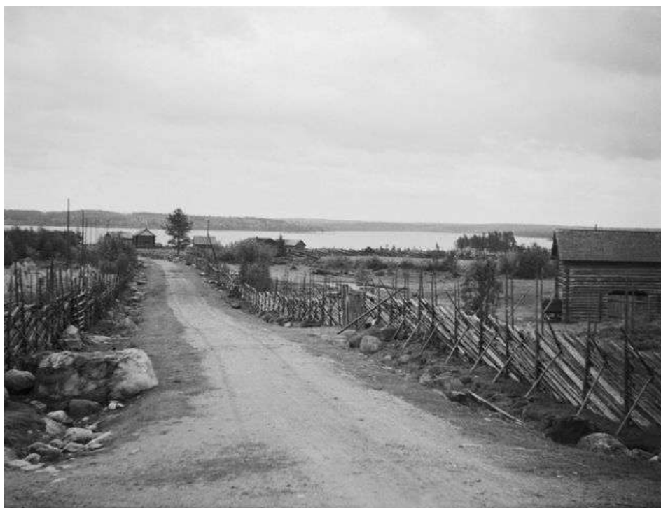
Liusvaaran kylää 1930-luvulla

Suurimpana syytä taudin tuhoisaa levetymiseen lloee kuluneina vuosina Ilomantsin salo seuduilla, mutta myöskin kylissäkin, kirkonkyläkin mukaan luettuna, vallinnut elintarpeiden puute joka viime talvena pääkehittymään toisiin paikkoihin suoransiksi nälänhädäksi, aiheuttanut useita kuolemantapauksia. Toiset jakeolivat pyyryisiä hergissä, mutta pitkäaikainen riittämättömän ruokailu ravinnolla eläminen on kuitenkin pahasti heikentanut elimistöä ja siten saattanut sen taudille alttiiksi, eikä heikentunut ruumis jaksa vastustaa taudin jäytävää kulkua, vaan hyvin monissa tapauksissa sortuu, vaikkapa lääkkeltä yleisesti käytetäänkin.