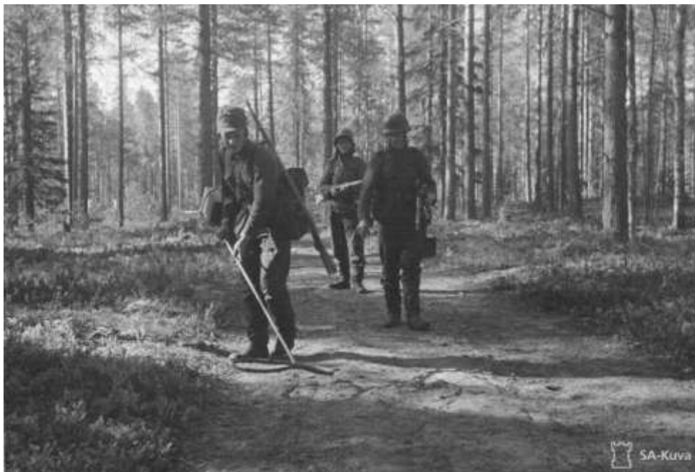
Miinaharavalla etsitään Ilomantsissa miinoja kesällä 1944

Kuuttivaaraan oli Salmijärveltä noin 10 km ja Kuuttivaaran laella olevat metsät oli kaadettu. Talojen pohjat näkyivät tien varteen, mutta mitään rakennuksia ei siellä enää ollut. Vaaran laelta oli hyvät näköalat Vaaksausjärven suuntaan, sillä siellä oli laajat suoalueet. Kuuttivaaralta laskeuduimme Kuolismaan suuntaan ja Kuuttilammen ja Elolammen välissä oli puinen silta. Tätä siltaa Pioneerit olivat menossa pannotamaan 13. heinäkuuta 1944. Seuraava puro löytyi muutama kilometri Kuolismaan suuntaan ja siinä ollut silta oli kadonnut ja jouduimme ajamaan autolla noin metrin syvän puron tai joen yli. Keskellä jokea vesi tulvi auton konepellille saakka, mutta venäläinen alikersantti kaasutteli autoa ja pääsimme puron toiselle puolelle. Salmijärveltä noin kilometri Kuuttivaaran suuntaan on notko, jossa tienvarressa oli vanhoja kuorma-autojen ruostuneita rakenteita. Sillä paikalla 13. ja 14. heinäkuuta sai surmansa lähes 30 miestä.