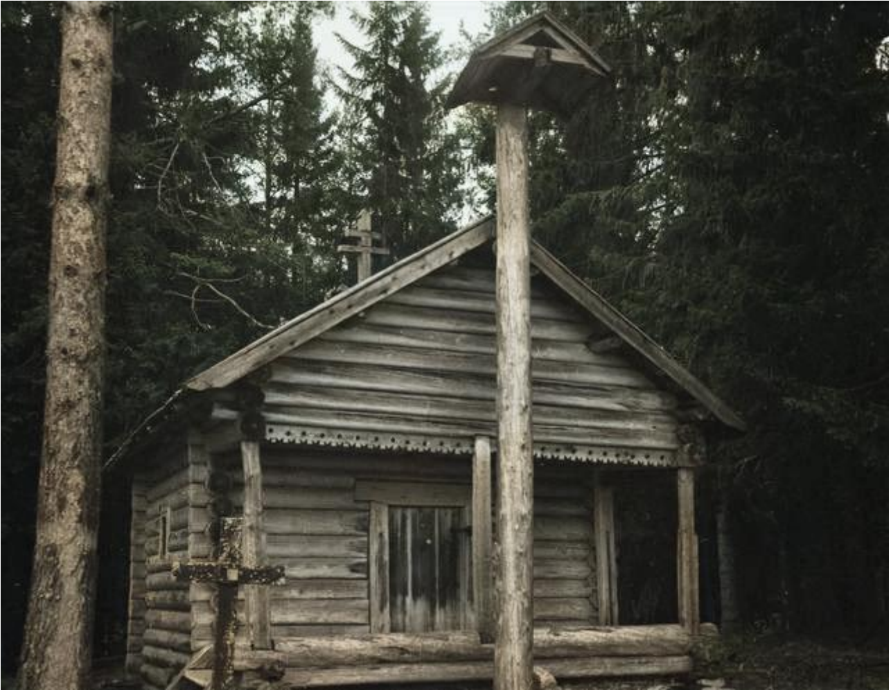
Kuolismaan tsasouna Kyljärven rannalla

Ilmoitettuamme asiamme talonväelle, hämmästyimme taas jonkin verran, kun isäntä alkoi sanoa, että ei hän lapsiperheitä ota mielellään. Esitteli veljensä taloon, johon käytiin myös kysymässä. Siihen oli jo luvatut asukkaat. Ei auttanut muu kuin meidän oli jäätävä taloon aivan kuin puoli väkisin, sillä olihan ikävä lähteä mihinkään, kun oli myöhä ilta ja kova lumituisku.