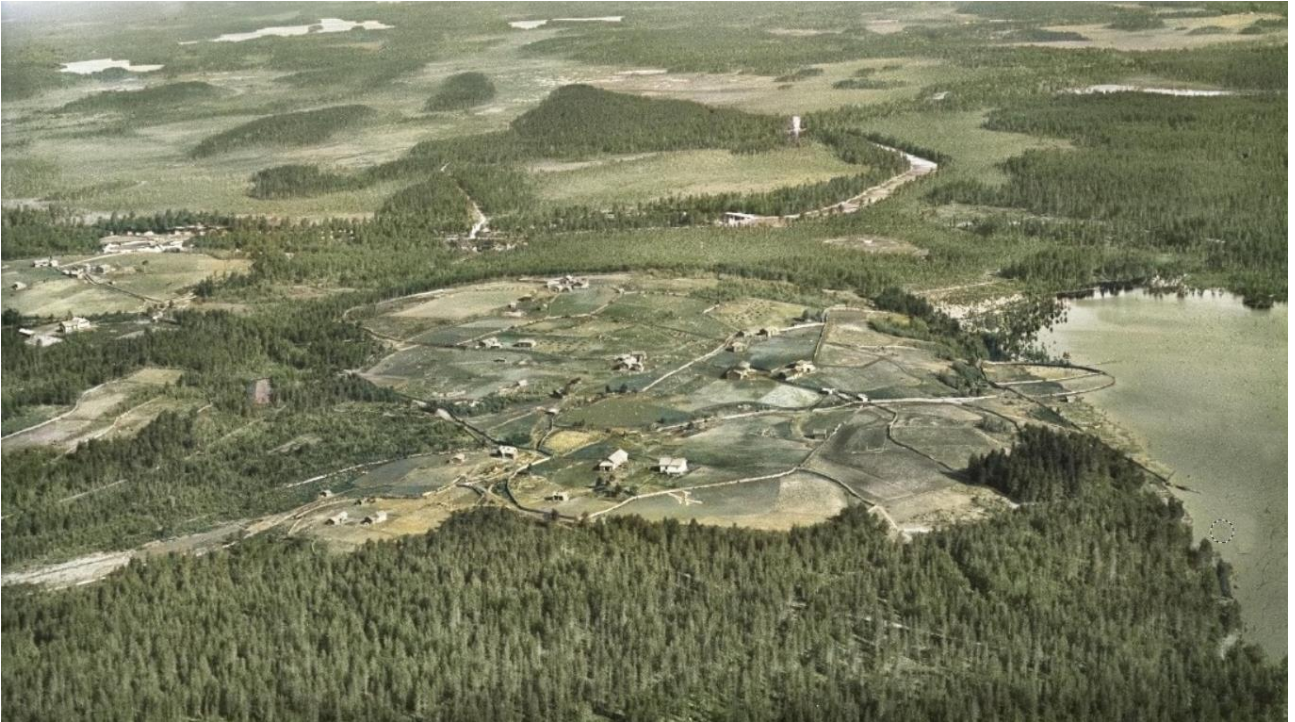
Kuolismaa kesällä 1929. Vasemmalla Kettulanvaara ja koulu, keskellä Rysylänvaara