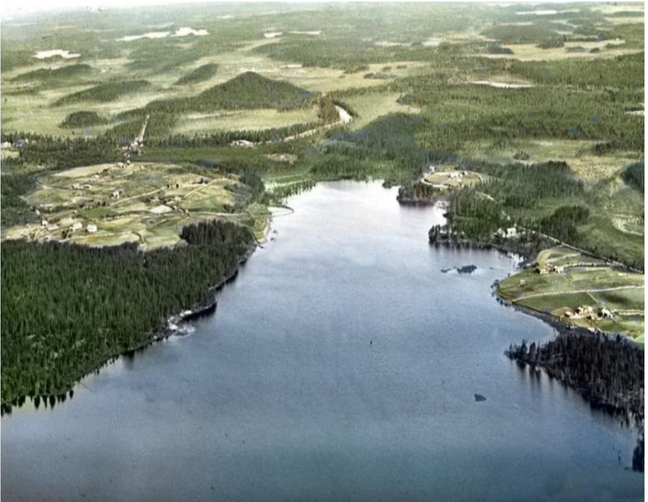
Kuolismaan kyläjärvi, vasemmalla Rysysvaara, oikealla Mikitanvaara mm. Sairasmaja