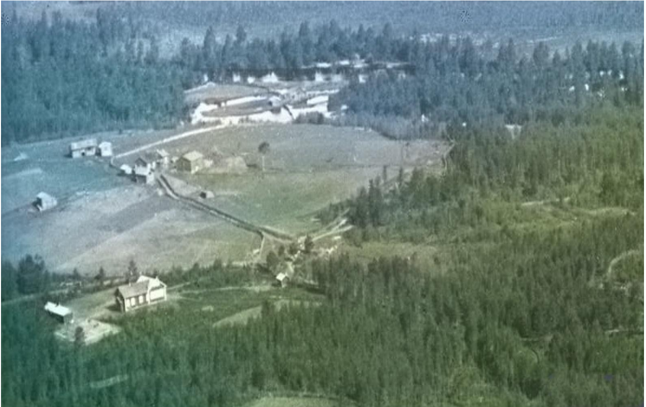
Matinvaara (Kettula vasemmalla keskellä, koulu vasemmalla edessä)