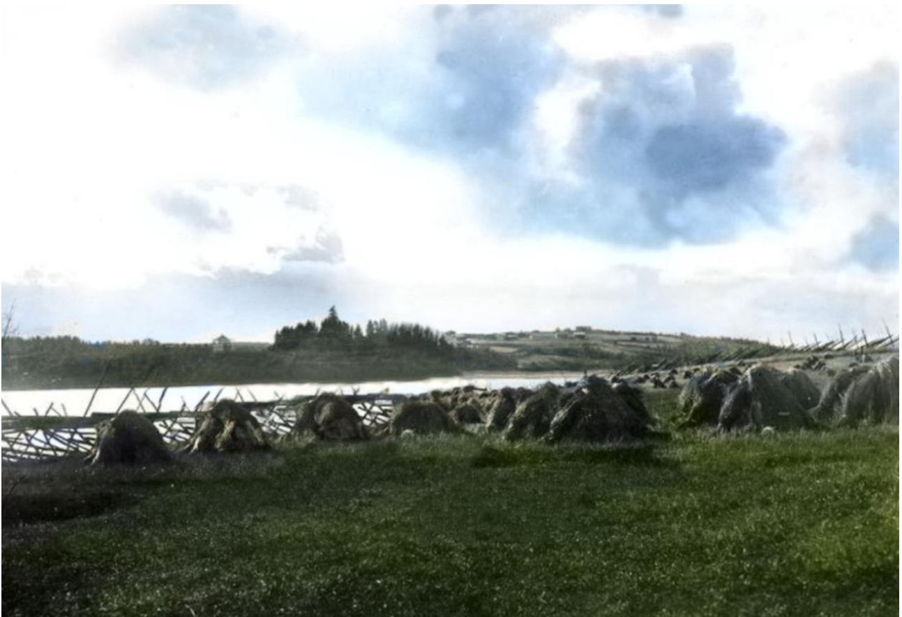
Kuolismaan kylää Mikitanvaaralta kuvattuna