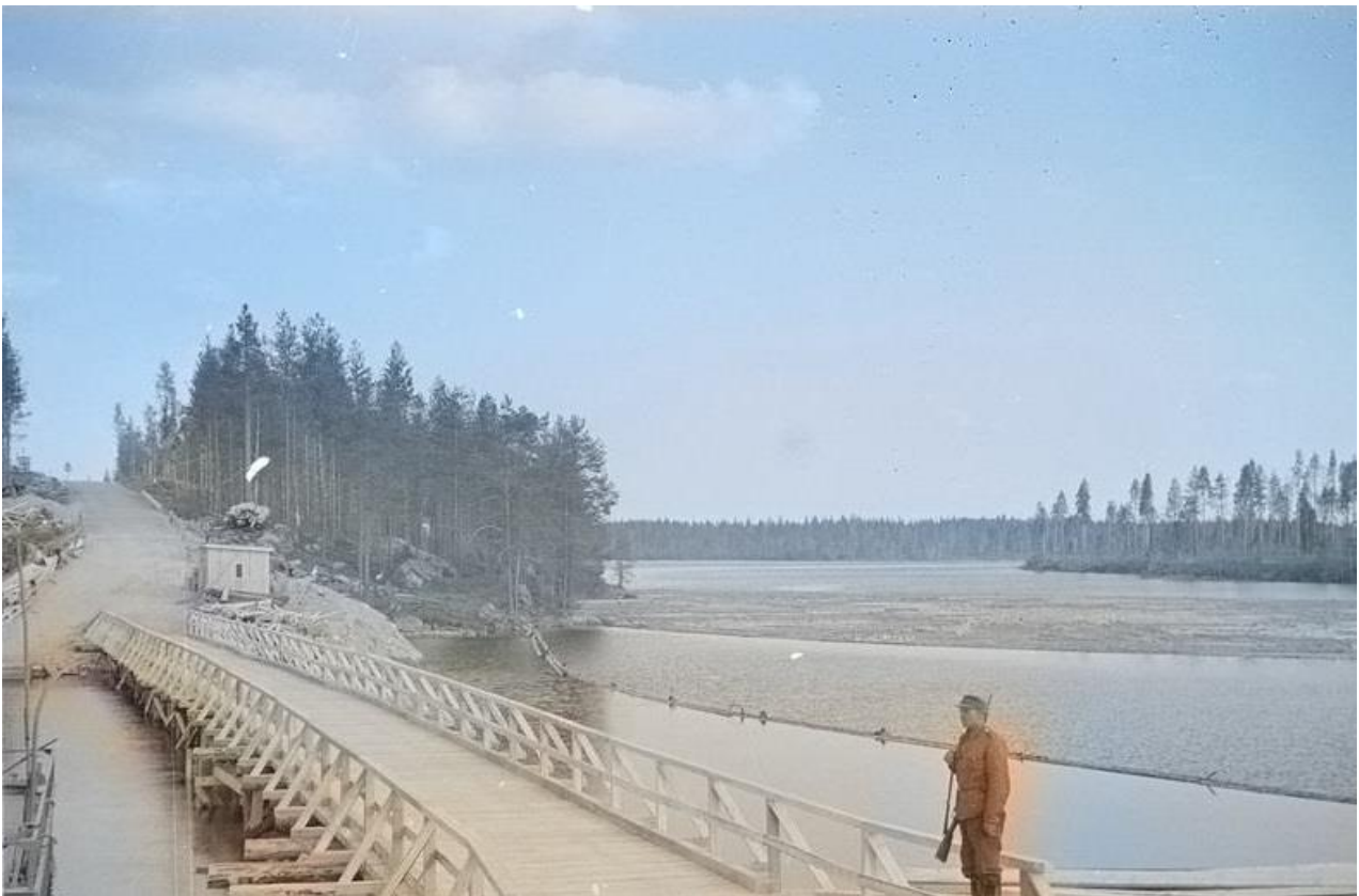
Oinassalmen silta 2.7.1941