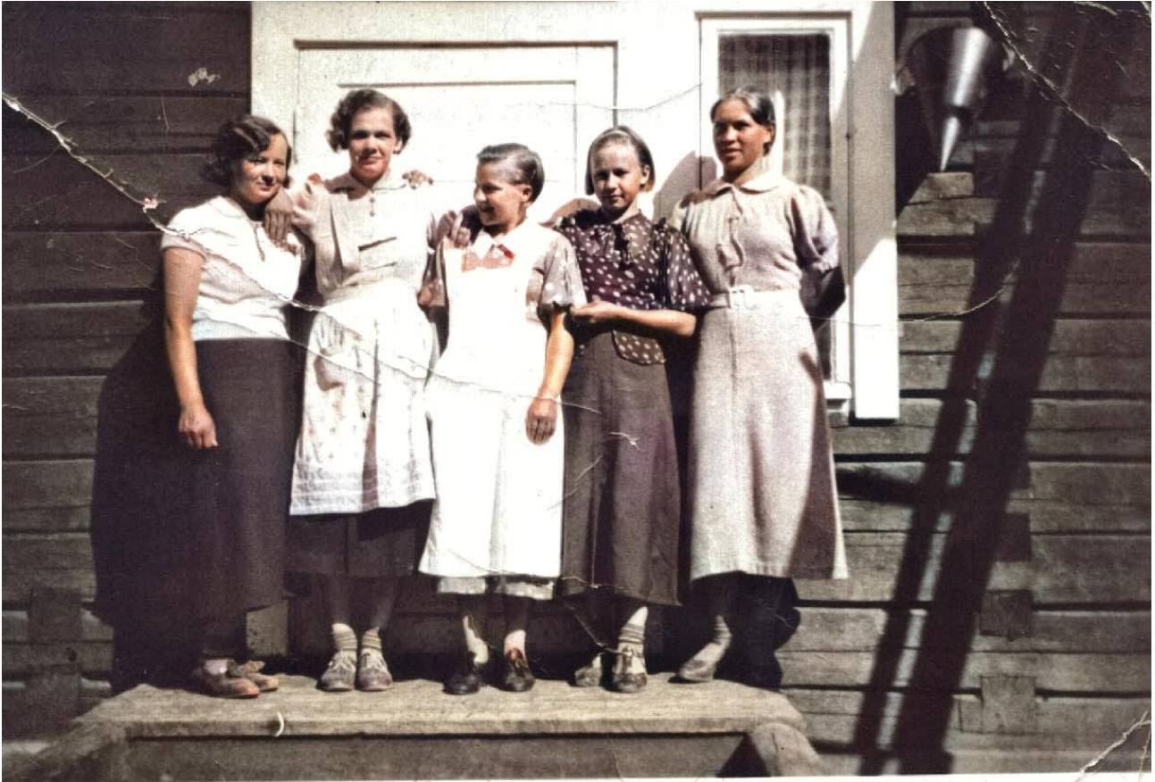
Kuolismaan tyttöjä Hoskosen kaupan rappusilla

Astelin sänkyäni luo, siinä jo nukkuivat lapset kaikessa rauhassa tietämättä mitään siitä tuskasta, mikä minun elämässäni oli ja mikä vei minulta sen yön unen ja levon.