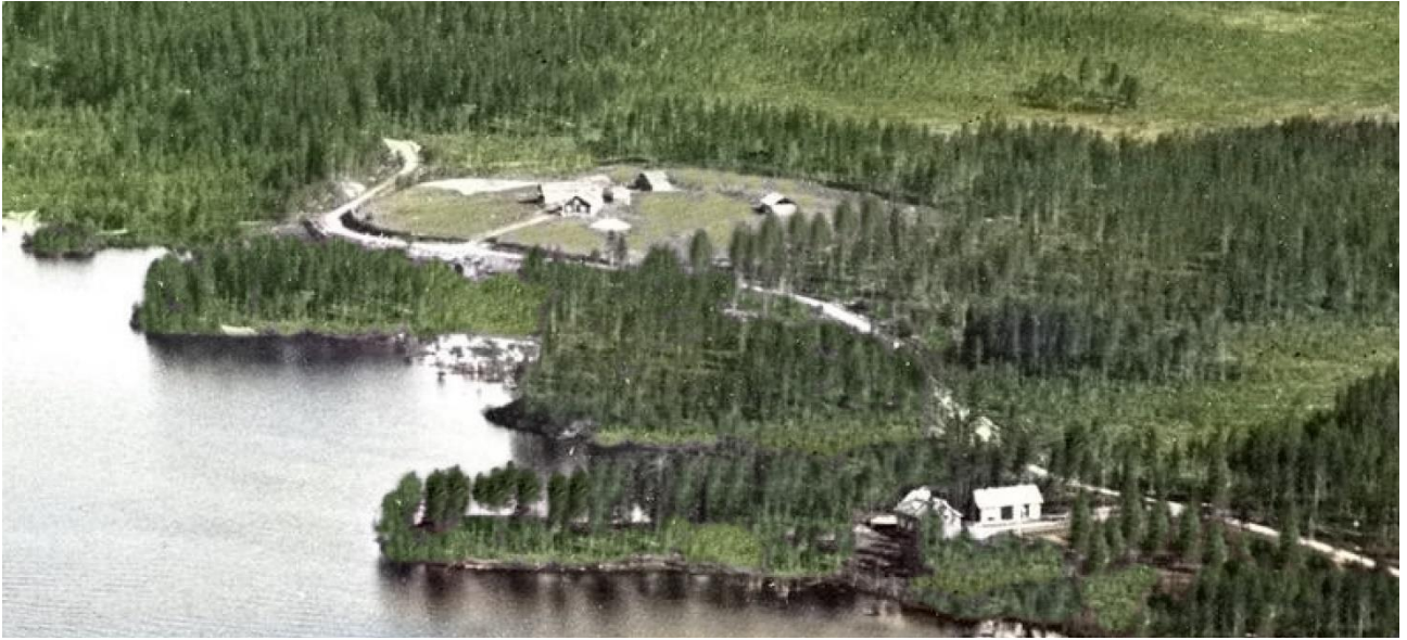
Takana Jehkimä Timoskaisen talo, edessä Sairasmaja