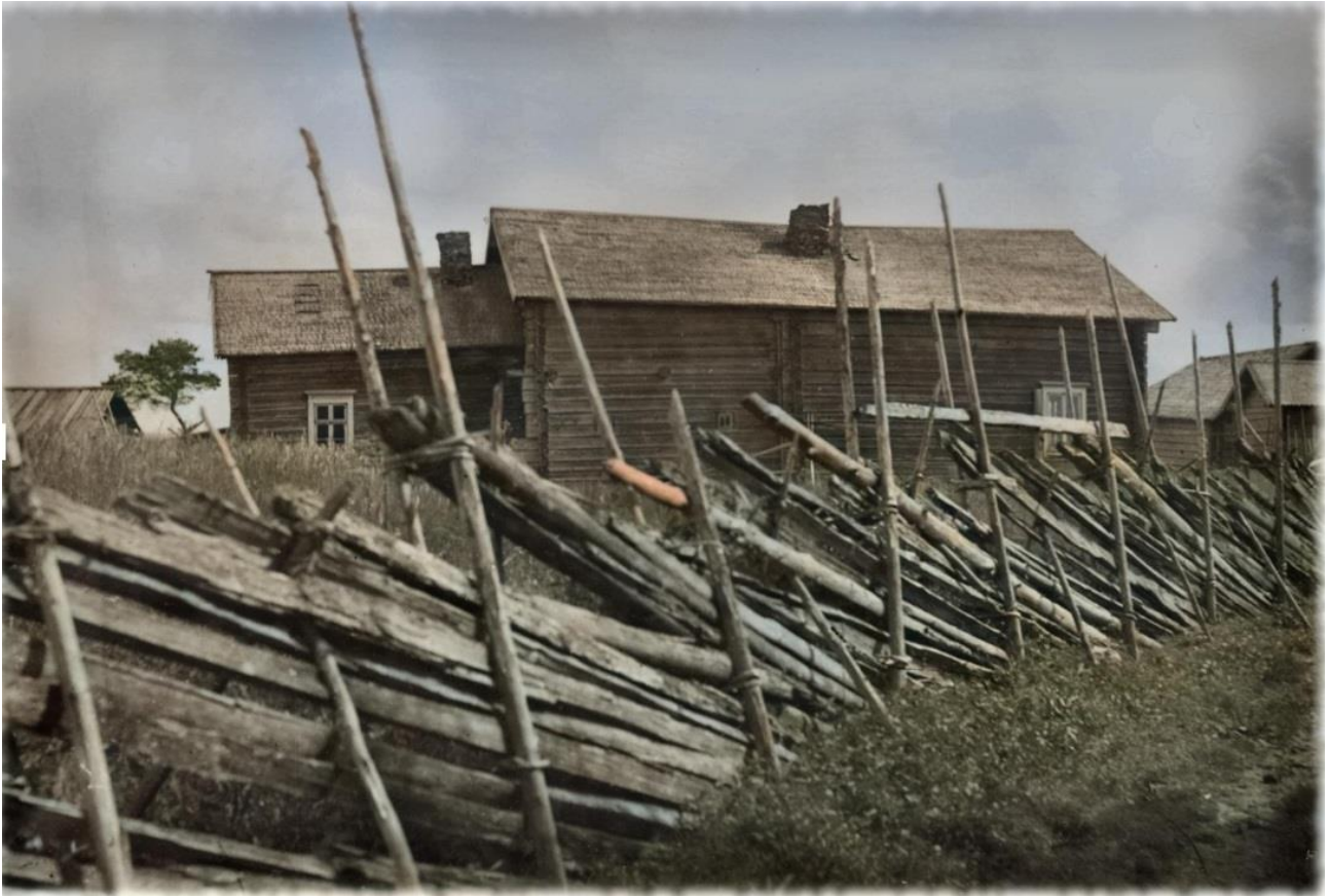
Kuolismaan Kettusten kantatila Matinvaaralla