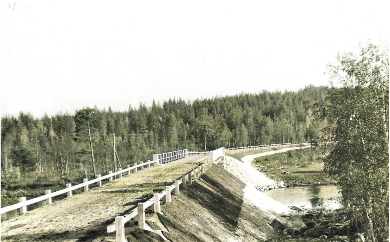
Luovenjoen silta 1930 luvun lopussa

Kirjoja olen kirjoittanut jo kymmenen ja seuraava kirjani ilmestyy syksyllä 2020. Kirjan nimi on Hyökkäys Tolvajärvellä. Kirjassa kerron jääkäripataljoonien sotahistoriaa Ilomantsin Peurujoelta Tolvajärven Ristisalmelle ja sieltä eteenpäin Onkamukseen. Kirjaa varten kävin kesällä 2019 kaksi kertaa Tolvajärvellä ja olen tutkinut satoja suomalaisia sotapäiväkirjoja, kymmeniä saksalaisten päiväkirjoja ja Neuvostoliiton arkistolähteitä. Kirjassa on sivuja reilut 300 ja se on A5 kokoinen ja liimasidottu. Kirjaa on saatavana lokakuusta 2020 lähtien nettikirjakaupoissa ja myös joissakin kirjakaupoissa.