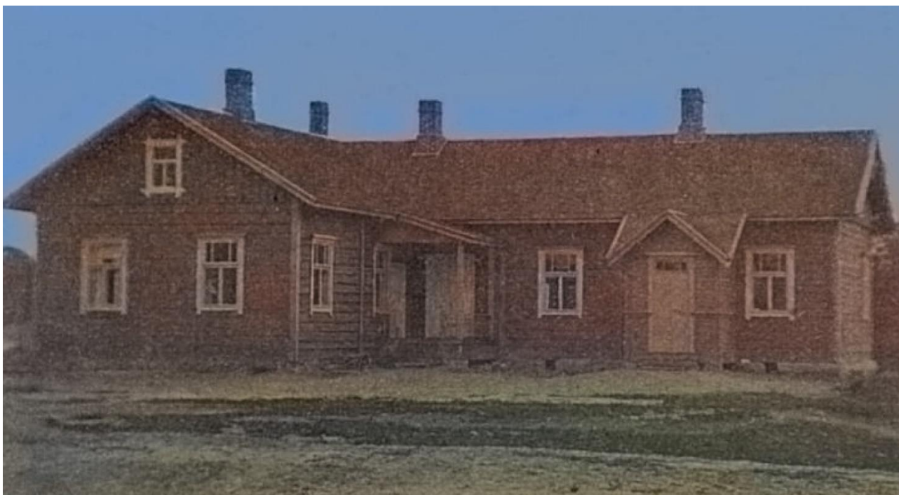
Möhkön Pytinki, eli Mallitalo vuonna 1914

Matkamme sitten jatkui eteenpäin. Tapasimme paljon tuttuja sekä tuntemattomia sotilaita, joita oli siellä maantien varrella. He vilkuttivat jäähyväisiksi. Vähitellen kotikyläni jäi kauas. Tiesin, että vartijajoukot vartioivat kotikylääni kaikilta vaaroilta, mutta sitä en tiennyt, kuinka lopulta kylämme käy?