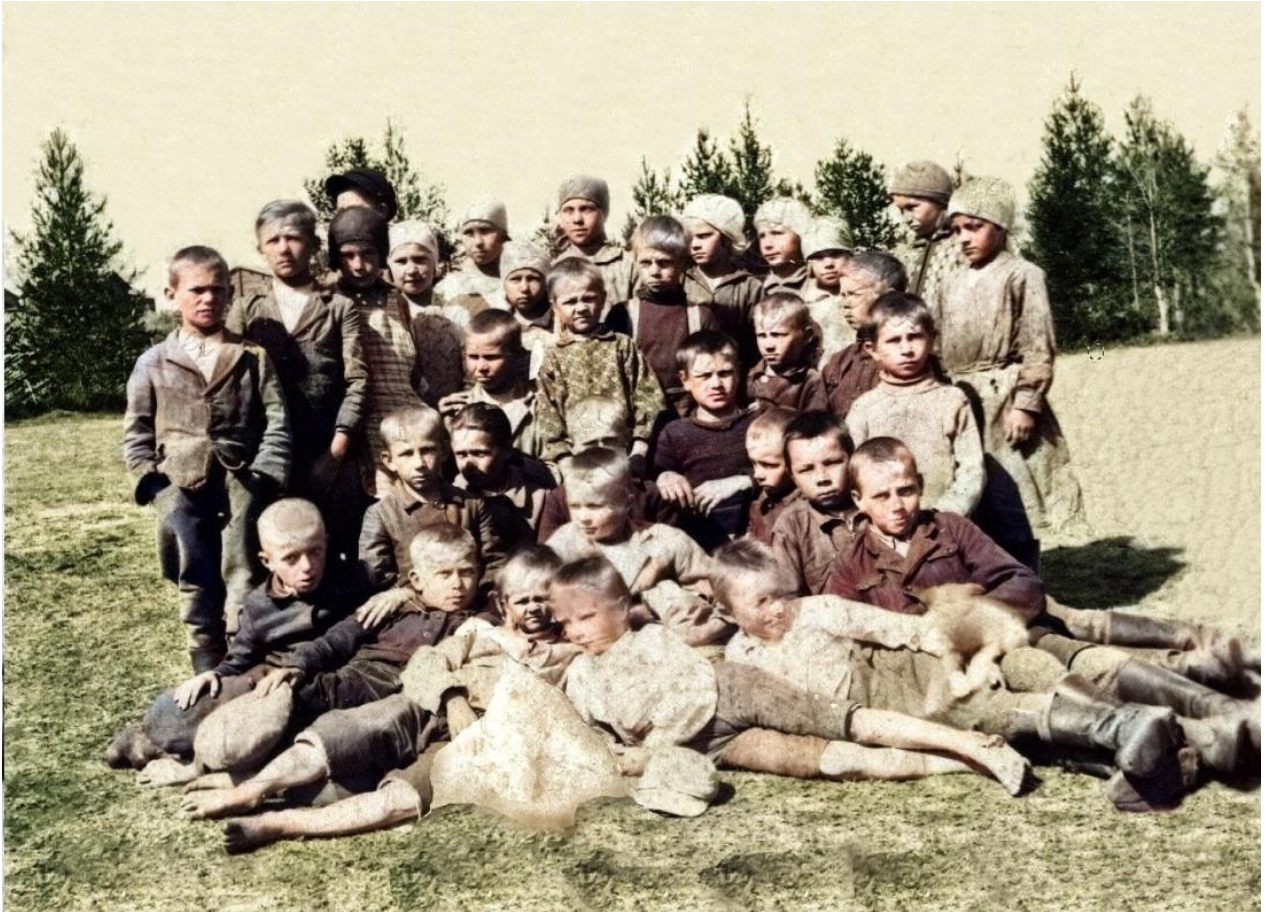
Koulukuva Kuolismaan koulun pohjoispuolen pellolta (kuva on heikkolaatuinen)