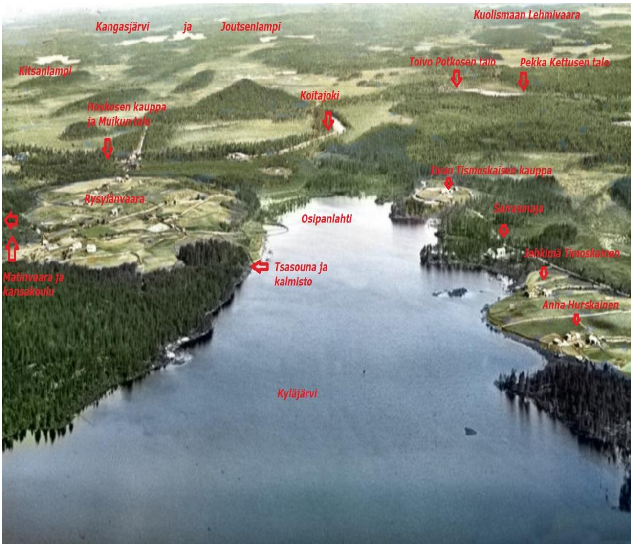
Kuolismaan kylä ilmakekuva