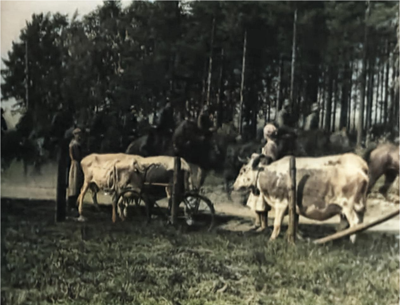
Evakot kohtaavat Hämeen ratsurykmentin rakuunat Pienviljelijäkoulun kohdalla 2.7.1941

Kuljimme sinä päivänä aika pitkän taipaleen. Saavuimme seuraavaksi yöksi Kontiolahdelle. Matkan varrella näimme laumoittain karjaa kuljettajineen, mutta paljon oli jäänyt karjaa uupuneina välille.