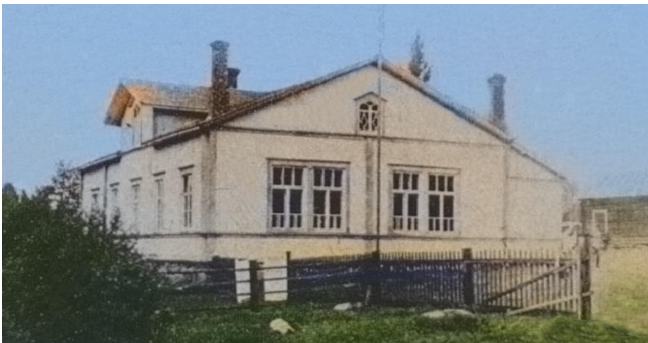
Möhkön vanha kansakoulu, kuva vuodelta 1929

Ei kuitenkaan käynyt niin, petyimme siinä ajatuksessa ihan totisesti. Olimme siinä talossa ihan kuin odotettuja vieraita, joka teki heti niin lämpöisen tunnelman – aivan kuin kotoisen lämmön olisimme saavuttaneet siinä aivan tietämättä. Lapset oli riisuttu samassa, kun vain päästiin sisälle ja kaikki oli niin ystävällisesti auttamassa aikuistenkin takkeja päältä naulakoihin. Ei näyttänyt olevan ylpeyden tunnetta yhtään meitä kodittomia kulkijoita kohtaan. Näytti siltä, että he osasivat ymmärtää kohtalomme vielä paremmin kuin me itse. Huomasin heti, kuinka kävi vaikuttavasti sen talon palvelijaan meidän sinne saapuminen. Hänen sisimmässään oli yhdenlainen kotikaipuun tunne – meidän elämäämme säälien näin heti, kuinka kyynelkarpalot putoilivat pitkin hänen poskipäitään. Hänellä oli paljon säälintunnetta meitä kohtaan, jota ei olisi arvannut edes aavistaa edeltä käsin.