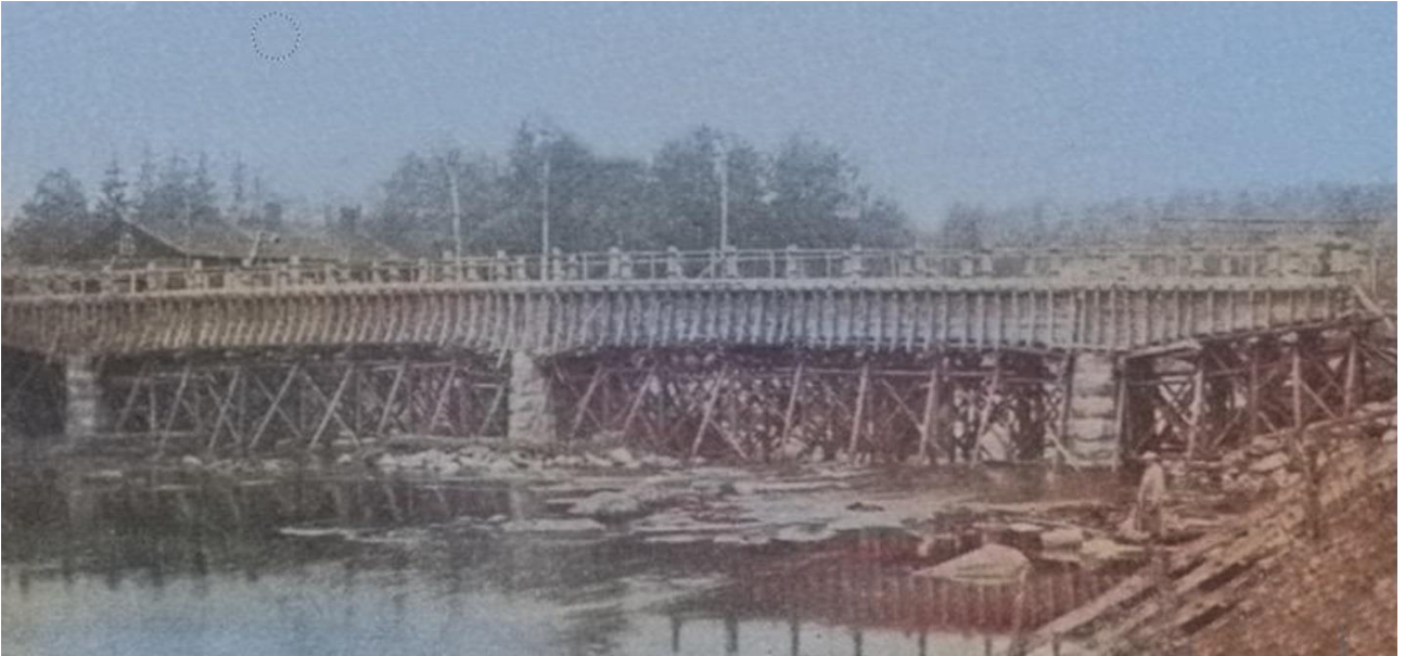
Möhkön silta vuonna 1924. Kuva on skannattu sanomalehdestä, jonka vuoksi kuva ei ole tarkka