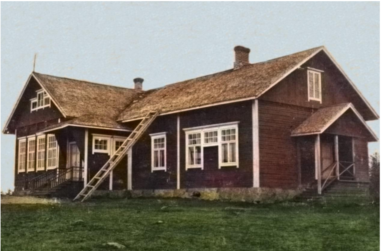
Kuolismaan kansakoulu rakennettu vuosina 1911 – 1915