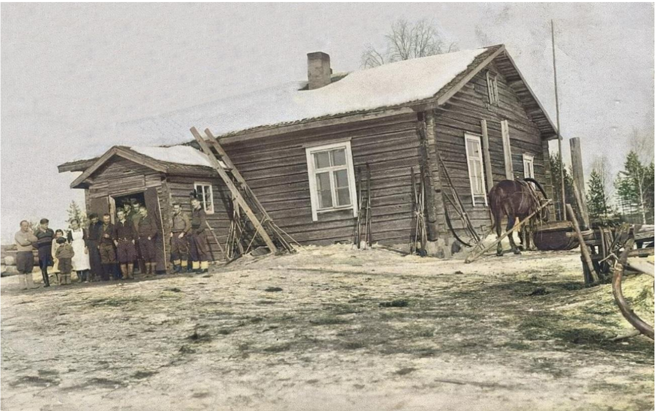
Josua Erosen talo Kuolismaan Lehmivaarassa