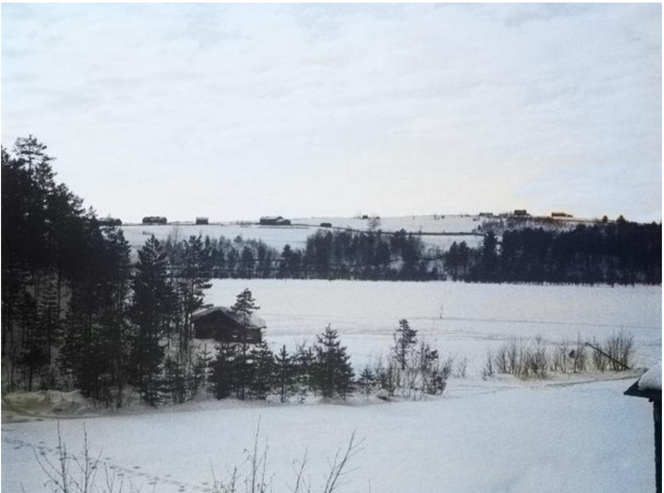
Kuolismaan kylä Mikitanvaaralta kuvattuna

Kävin vielä hakemassa heiniä ison kasan Helunan eteen samoin vettä varasin, että ei edes lähivuoro-kausina näänntyisi nälkään. Painoin navetan oven sitten kiinni ja kiiruhdin tupaan, jossa jo odottivat matkaan lähtijät. Koetin salata kyyneleeni lapsiltani, että he ei joutuisivat niin liikuttuneeksi tästä kaikesta, minkä koetin itse kestää. Lähtöhetki lähenei lähenemistään. Katselin ympärilleni, silmäilin kaikkea, huomasin siinä vasta, miksi täytyy kaiken jäädä näin – vapaasti tähän paikoilleen. Kuka näistä huolehtii ja milloin, vai ovatko nämä näin vielä silloinkin, kun takaisin tulemme. Se oli vain harha-ajatus, jossa varmaan moni muukin on pettynyt, en yksin minä!