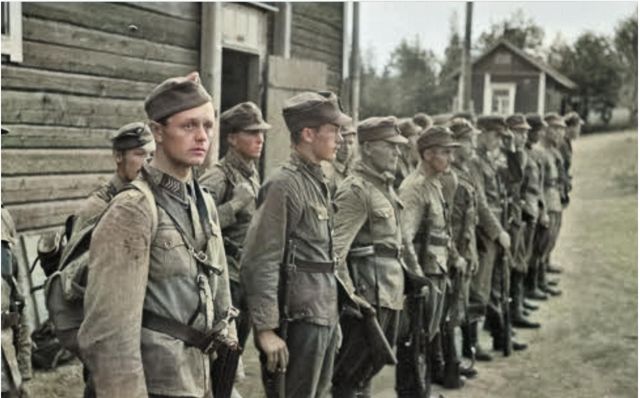
Ilomantsi Rajakomppania Teppanassa 8.7.1941 (Ontronvaaran tehdyn hyökkäyksen jälkeen)

Oltiin vihdoin maaliskuussa, joka toi sen ikävän taas, ainakin minä tunsin oloni kahta raskaammaksi – tiesinhän hyvin, kuinka kotini on käynyt ja sitten ei toivoakaan ollut kotiinpaluusta, kun ne seudut jäi kaikki rajan toiselle puolelle.