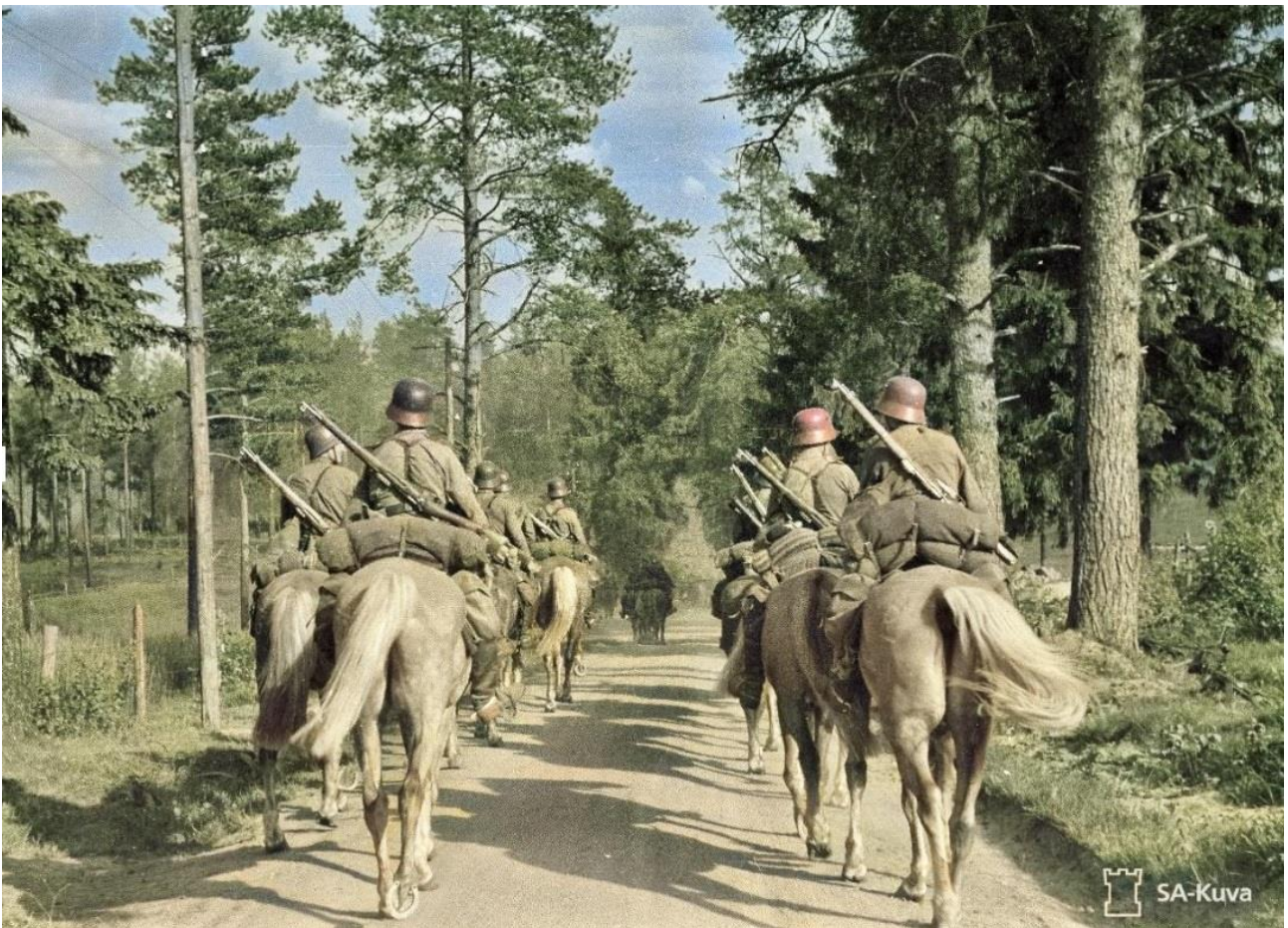
Rakuunat Pienviljelijäkoulun mäessä 2.7.1941

Aloin ajatella uuden kodin laittamista ja se onnistuikin hyvin. Mieheni sattui pääsemään lomalle siksi hyvään aikaan, että oli apuna järjestämässä tarvikkeita paikan päällä. Sitten vain miehet töihin ja koti alkoi olla valmis – päästiin muuttamaan joulukuksi 1943. Oli niin hauskaa ja suloista järjestellä omaan kotiin joulujuhlaa. Lapsetkin nauttivat niin paljon kaikesta, kun vielä isäkin pääsi joulukuksi kotiin – se oli ensimmäinen joulu yhdessä neljään vuoteen. Saimme tuntea kodin lämmön ja rauhaisan olon. Mutta ei ihmiselle iloa kauan anneta.