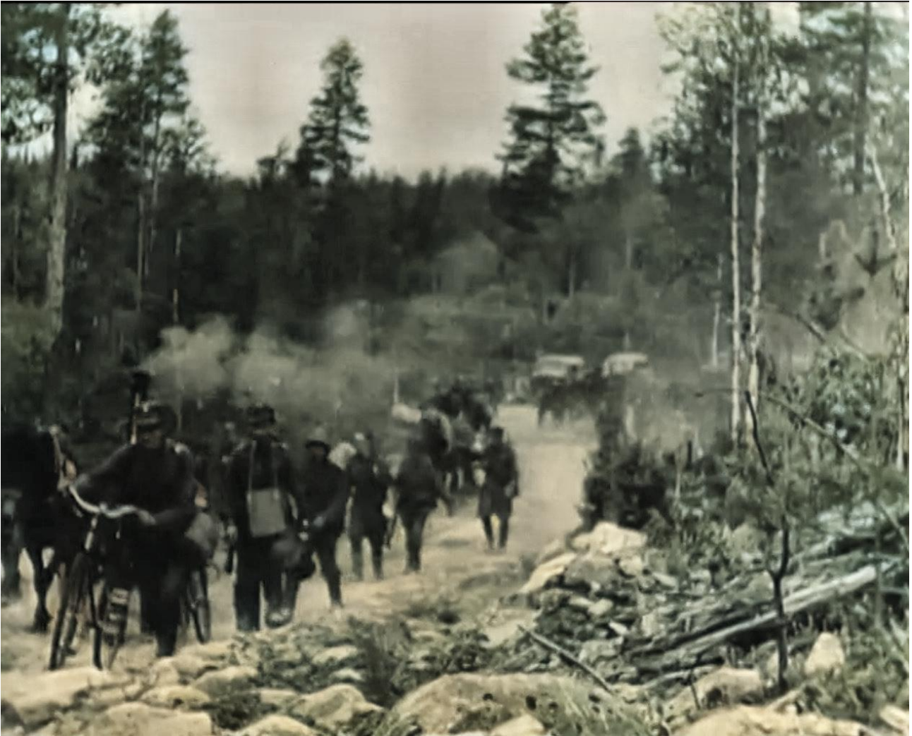
Jääkäripataljoona yksi nousemassa Louhivaaralle 21.7.1941

Ei auttanut kyyneleet. Kaikki tuntui kiertävän esiin vähitellen niin kuin joltakin lankakerältä lanka vähitellen tulee esiin huonompana ja parempana. Iloisempaa ja ikävää mekin saatiin kokea vähällä aikaa. Ei juuri erikoista iloa, vain jotakin mielenlohdutusta, kun ymmärsivät meitä. Mutta mieluummin surua ja ikävää – osansa on varmaan saanut useampi maistaa.